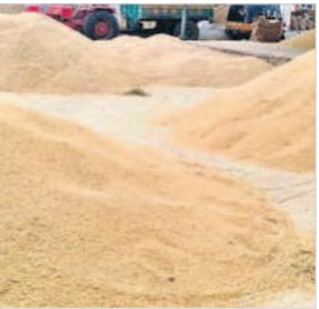
బాదేపల్లి వ్యవసాయ మార్కెట్కు అమ్మకానికి వచ్చిన ధాన్యం

గద్వాల అర్బన్, డిసెంబర్ 15 : సన్న ధాన్యం ధర గతంలో ఎన్నడూ లేని విధంగా రికార్డు పలుకుతుంది. గద్వాల మార్కెట్ చరిత్రలో ఎన్నడూ లేని విధంగా క్వింటా రూ.3,413 ధరలు పలుకుతున్నాయి. గత సీజన్లో రూ.2,300 ధరల పైగా పలికితే.. ప్రస్తుతం రూ.3,413 ధరలు నడుస్తున్నాయి. గతంలో కంటే వెయ్యి రూపాయలు అధిక ధరలు రావడం రైతుల సంతోషానికి అవధులు లేవు. ధాన్యానికి మంచి ధర