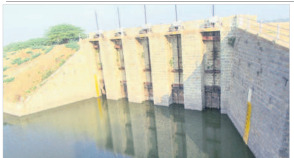
ఆర్డీఎస్ ఆనకట్టలో ప్రస్తుత నీటి నిల్వ