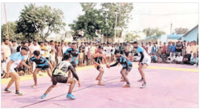
కొత్తపల్లిలో కబడ్డీ పోటీల్లో తలపడుతున్న జట్లు