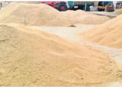
బాదేపల్లి వ్యవసాయ మార్కెట్కు అమ్మకానికి వచ్చిన ధాన్యం

గద్వాల అర్బన్, డిసెంబర్ 15 : సన్న ధాన్యం ధర గతంలో ఎన్నడూ లేని విధంగా రికార్డు పలుకుతుంది. గద్వాల మార్కెట్ చరిత్రలో ఎన్నడూ లేని విధంగా క్వింటా రూ.3,413 ధరలు పలుకుతున్నాయి. గత సీజన్లో రూ.2,300 ధరల పైగా పలికితే.. ప్రస్తుతం రూ.3,413 ధరలు నడుస్తున్నాయి. గతంలో కంటే వెయ్యి రూపాయలు అధిక ధరలు రావడం రైతుల సంతోషానికి అవధులు లేవు. ధాన్యానికి మంచి ధర