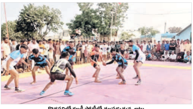
కొత్తపల్లిలో కబడ్డీ పోటీల్లో తలపడుతున్న జట్లు