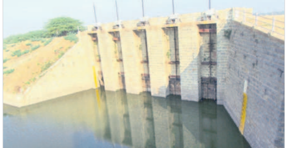
ఆర్డీఎస్ ఆనకట్టలో ప్రస్తుత నీటి నిల్వ