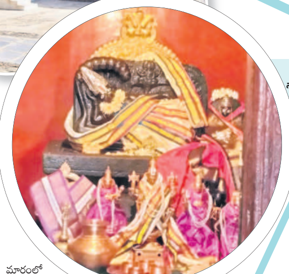
శ్రీ రంగ నాథ స్వామి

గంగాల టౌన్, డిసెంబర్ 15 : శ్రావణ మాసం, మాఘమాసం, కార్తీకమాసంతో పాటు హైందవ సంస్కృతిలో ధనుర్మాసానికి కూడ పెద్దదే పేరే. ఈ మాసమంతా కూడా మహావిష్ణువును భక్తితో కొలుస్తారు. ఈ నెల మొత్తం ప్రతి రోజూ ఉదయం, సాయంత్రం దీపారాధన చేయడం వల్ల మహాలక్ష్మి కరుణా కలాపాలు కలుగుతాయన్నది భక్తుల నమ్మకం. ఎన్నో విశిష్ట తలు, ప్రత్యేకతలు ఉన్న ధనుర్మాసం సంక్రాంతి పండుగకు ముందు ప్రారంభమవుతుంది. అదివారం నుంచి జనవరి 16వ తేదీ వరకు ధనుర్మాసం ఉంటుంది. ధనుర్మాసమంటే.. ధనుర్మాసంలో ధనుర్మాసానికి సూర్యుడు ప్రవేశించిన సమయం ధనుస్సంక్రమణం. ధనుస్సులో