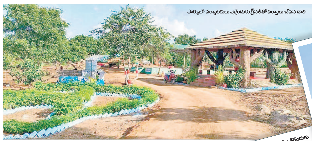
పార్కులో పర్యాటకులు వెళ్లొందుకు గ్రీన్ రీతో ఏర్పాటు చేసిన డారి