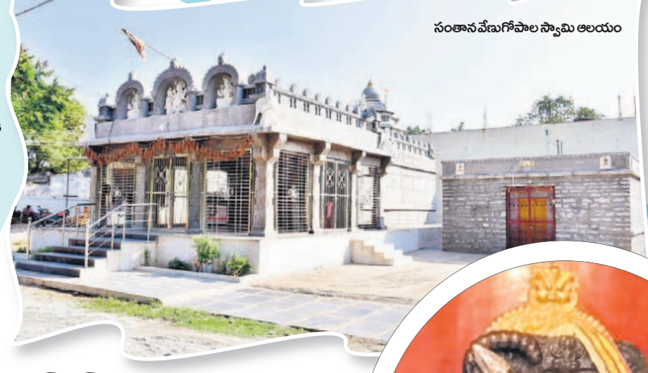
సంతానవేణగోపాల స్వామి ఆలయం