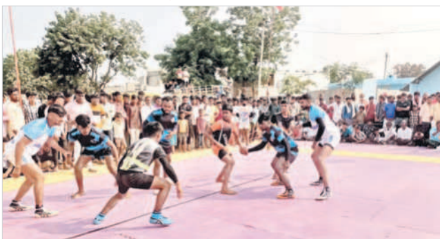
కొత్తపల్లిలో కబడ్డీ పోటీల్లో తలపడుతున్న జట్లు