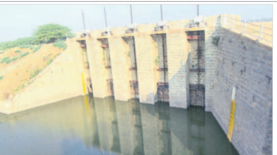
ఆర్డీఎస్ ఆనకట్టలో ప్రస్తుత నీటి నిల్వ