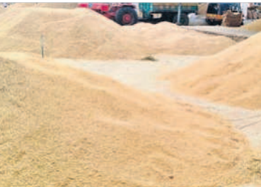
బాదేపల్లి వ్యవసాయ మార్కెట్కు అమ్మకానికి వచ్చిన ధాన్యం

111క్వింటాళ్ళ సోన రకం ధాన్యం అమ్మకానికి రాగా క్వింటాకు గరిష్ఠంగా రూ.2,460 ధర పలికింది. అదే విధంగా మార్కెట్కు 81 క్వింటాళ్ళ వేరుశనగ అమ్మకానికి రాగా దానికి క్వింటాకు గరిష్ఠంగా రూ.8,040 ధర పలికింది. అదేవిధంగా మార్కెట్కు 5క్వింటాళ్ళ రాగులు అమ్మకానికి రాగా క్వింటాకు గరిష్ఠంగా రూ.3,517 ధర పలికింది. మద్దతు ధర కంటే రూ. 1,100 ఎక్కువ గద్వాల అర్బన్, డిసెంబర్ 15 : సన్న ధాన్యం ధర గతంలో ఎన్నడూ లేని విధంగా రికార్డు పలుకుతుంది. గద్వాల మార్కెట్ చరిత్రలో ఎన్నడూ లేని విధంగా క్వింటా రూ.3,413 ధరలు పలుకుతున్నాయి. గత సీజన్లో రూ.2,300 ధరల పైగా పలికితే.. ప్రస్తుతం రూ.3,413 ధరలు నడుస్తున్నాయి. గతంలో కంటే వెయ్యి రూపాయలు అధిక ధరలు రావడం రైతుల సంతోషానికి అవధులు లేవు. ధాన్యానికి మంచి ధర