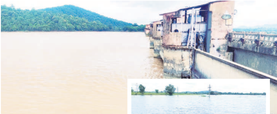
పూర్తి నీటిమట్టంతో నిండు కుండను తలపిస్తున్న కడెం ప్రాజెక్టు