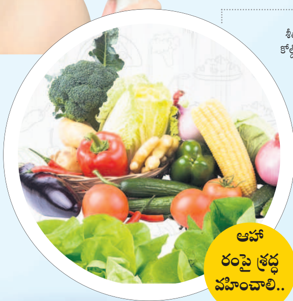
ఆహారంపై శ్రద్ధ వహించాలి..

వారం రోజులుగా పాపంమతో పాటు చలి తీవ్రత బాగా పెరిగింది. రానున్న రోజుల్లో చలి మరింత పెరిగే అవకాశం ఉన్నందున చర్మాన్ని రక్షించుకోవడానికి ప్రతి ఒక్కరూ జాగ్రత్తలు తీసుకోవడం తప్పని సరి. చలికాలం వచ్చినందులో చర్మం తెల్లగా పొడిబారిపోతుంది. అంతే కాకుండా చర్మం అసహనానికి గురి చేస్తుంది. చలికాలం ఒక్కణ్ణా చిటపటలాడుతున్నట్లు అనిపిస్తుంది. చలి తీవ్రత పెరిగే కొద్దీ చర్మం రంగు, రూపు మారిపోతాయి. చలి తాకిడికి చర్మం మృదు సుఖాన్ని కోల్పోయి చర్మంపై పగుళ్లు ఏర్పడి తీవ్ర ఇబ్బందులకు గురవుతుంటారు. పగుళ్ళ నుంచి రక్తించుకునేందుకు కోల్డ్ క్రీములను వాడుతూ చిన్న పాటి జాగ్రత్తలు పాటించి మన చర్మం సౌందర్యం నిగనిగలాడుతూ ఎలాంటి పగులళ్లకు లోను కాకుండా మృదువుగా ఉంటుంది.