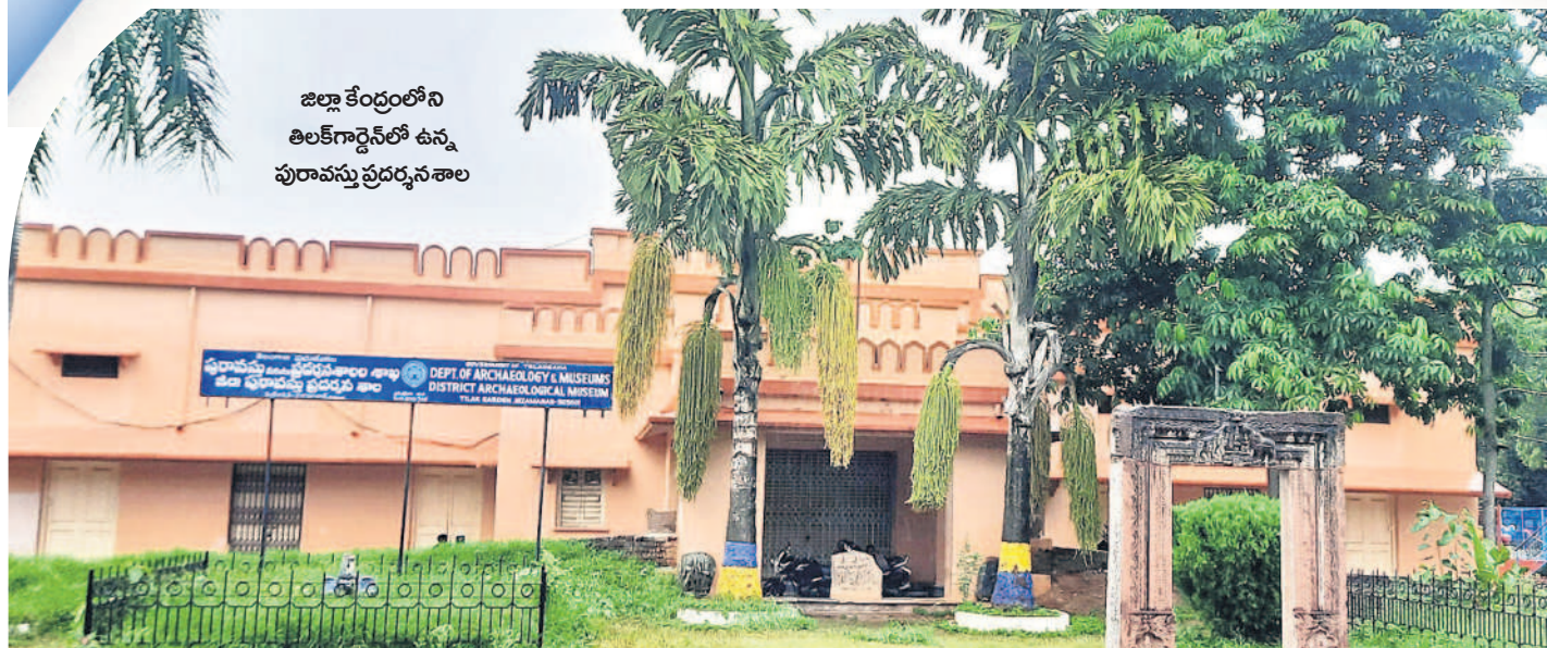
జిల్లా కేంద్రంలోని తిలక్ గార్డెన్ లో ఉన్న పురావస్తు ప్రదర్శనశాల