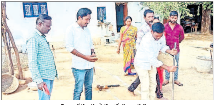
నిర్మాణ పనులను ప్రారంభస్తున్న నాయకులు