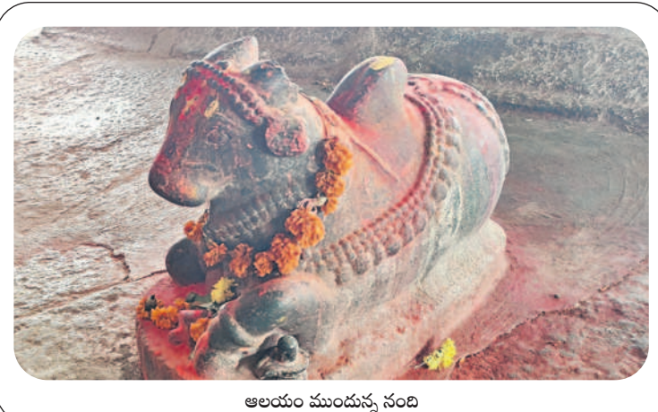
ఆలయం ముందున్న నంది