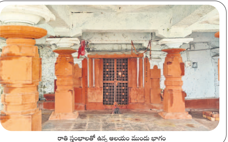
రాతి స్తంభాలతో ఉన్న ఆలయం ముందు భాగం

అంశంపై ఆంగ్లంలో 80 నిమిషాల్లో రాయాల్సి ఉంటుందన్నారు. ఒకసారి ఎంపిక చేసిన అంశం మాార్చిండుకు వీలులేదు? పోస్టర్ మేకింగ్ (మెయింటింగ్) చేసేందుకు 90 నిమిషాల సమయం ఇస్తారని తెలిపారు. మెయింటింగ్ సామగ్రి తెచ్చుకోవాలని, వక్రత్రస్ పోటీలు, అభ్యర్థులు లాటో డ్యాం ఎంపిక