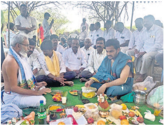
ఎల్లమ్మ దేవాలయ పునర్నిర్మాణం పనుల వద్ద పూజలు చేస్తున్న రామస్థులు, భక్తులు