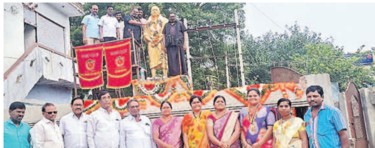
దేవరకొండ: పాట్టి శ్రీరాములు విగ్రహానికి పూలమాల వేస్తున్న ఆర్యవైశ్య సంఘం నాయకులు