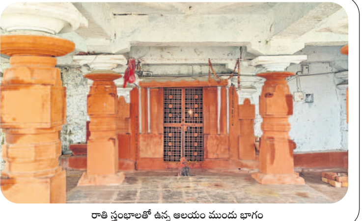
రాతి స్తంభాలతో ఉన్న ఆలయం ముందు భాగం

అంశంపై ఆంగ్లంలో 80 నిమిషాల్లో రాయాల్సి ఉంటుందన్నారు. ఒకసారి ఎంపిక చేసిన అంశం మాార్చిండుకు వీలులేదు? పోస్టర్ మేకింగ్ (మెయింటింగ్) చేసేందుకు 90 నిమిషాల సమయం ఇస్తారని తెలిపారు. మెయింటింగ్ సామగ్రి తెచ్చుకోవాలని, వక్రత్య పోటీలు, అభ్యర్థులు లాటో డ్యాం ఎంపిక