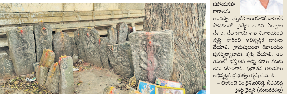
అలయం అభివృద్ధికి కృషి..