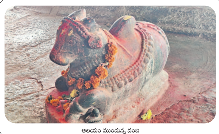
ఆలయం ముందున్న నంది