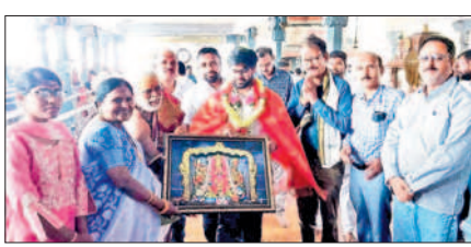
అమ్మవారి చిత్రపటం అందజేస్తున్న ఆలయ బాధ్యులు

అప్పట్లో కేయా అధికారులను కలిసి వినతిపత్రం సమర్పించారు. అయినా వారు స్పందించలేదు. ప్రొఫెసర్ పదోన్నతి కోసం 16 మందికి, సీనియర్ ప్రొఫెసర్ పదోన్నతి కోసం ఆరుగురికి మాత్రమే కాలే లెటర్లు పంపి డిసెంబర్ 19, 20 తేదీల్లో ఇంటర్వ్యూలు నిర్వహించారు. 16 మందిలో 14 మందికి ప్రొఫెసర్ గా, ఆరుగురిలో ఐదుగురికి సీనియర్ ప్రొఫెసర్ గా ఉద్యోగోన్నతి కల్పిస్తూ డిసెంబర్ 28 రాత్రి 11 గంటలకు ఉత్తర్వులు జారీ చేశారు. దీంతో అదే రోజు రాత్రి ఉద్యోగోన్నతి పొందిన వారు జాయిన్ గా రిపోర్ట్ ఇచ్చారు. అయితే, అన్ని అర్హతలు ఉన్న తనతోపాటు అకట్ అధ్యక్షుడు ప్రొఫెసర్ తోటం శ్రీనివాసుకు వ్యక్తిగత కక్షలతో ఉద్యోగోన్నతి నిలిపివేసి అక్రమమార్గంలో వీసీ, రిజిస్ట్రార్ ఉద్యోగోన్నతి పొందారని అకట్ కార్యదర్శి మామిడాల ఇస్మార్ హైకోర్టును ఆశ్రయించారు. వీరు రిజిస్ట్రార్ కు ఉద్యోగోన్నతి పొందాలనే దురుద్దేశంతో ఇలా చేశారని హైకోర్టులో సమర్పించిన ఆఫీడవిట్ లో ఇస్మార్ పేర్కొన్నారు.