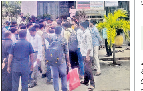
ఆందోళన చేస్తున్న బాధితులు

సుబేదారి, డిసెంబర్ 15 : నక్కల గుట్టలోని అక్షర చిట్ ఫండ్ ప్రధాన కార్యాలయం ఎదుట శుక్రవారం చిట్టి బాధితులు అధిక సంఖ్యలో తరలివచ్చి ధర్నా నిర్వహించారు. రాష్ట్రంలోని వివిధ బ్రాంచ్ లకు చెందిన బాధితులు కార్యాలయం ఎదుట బయటించి ఆందోళనకు దిగారు. చిట్టి డబ్బులు ఇవ్వకుండా నెలల తరబడి ఆఫీసుల చుట్టూ తిప్పించుకుంటున్నారని బాధితులు మండిపడ్డారు. బాధితుల ఆందోళనతో కార్యాలయ సిబ్బంది బయటి వచ్చి నచ్చజెప్పే ప్రయత్నం చేశారు.