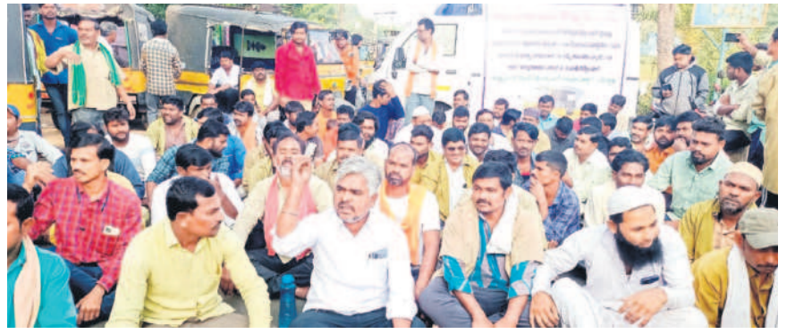
తాంసి (తలమడుగు): ఖోడర్ అంతర్జాతీయ రహదారిపై బైటాయింపిన ఆటో డ్రైవర్లు, యూనియన్ నాయకులు