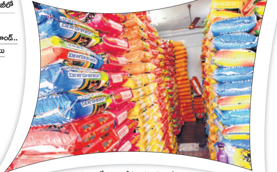
దుకాణంలో అమ్మకానికి ఉంచిన బియ్యం బస్తాలు

- మంచిర్యాల, డిసెంబర్ 16 (నమస్తే తెలంగాణ ప్రతినిధి)