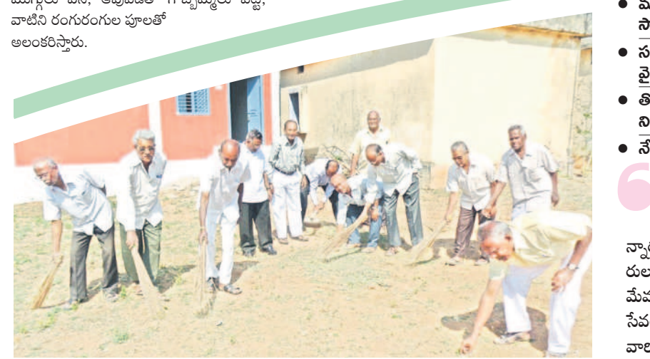
స్వచ్ఛభారత్ లో భాగంగా పరిసరాలూ శుభ్రం చేస్తున్న విశ్రాంత ఉద్యోగులు (ఫైల్)