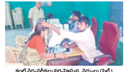
కంటి వైద్యచికిత్సలు విధిస్తున్న వైద్యులు (ఫైల్)

“మలిదశలోనూ సలుగురికి సాయం చేస్తూ.. సామాజిక సేవలో ముందుండి ఆదర్శంగా నిలుస్తున్నారని వేములవాడలోని విశ్రాంత ఉద్యోగులు. సహచరులకు అవసరమైన వైద్య సేవలు ఉచితంగా అందిస్తూ మేమున్నామంటూ భరోసానిస్తున్నారు. అలుపెరగని సేవలందిస్తూ.. తోటివారికి అండగా నిలుస్తుండగా, వారిని పలువురు అభినందిస్తున్నారు.