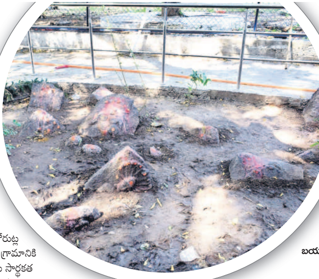
నాగులపేటలో బయటపడిన నాగ ప్రతిమలు

జగిత్యాల, డిసెంబర్ 16(నమస్తే తెలంగాణ): కోరుట్ల మండలంలోని ఒక చిన్న గ్రామం నాగులపేట. ఈ గ్రామానికి ఆ పేరు ఎలా వచ్చిందో తెలియదు కానీ, ఆ పేరుకు సార్థకత చేకూర్చుతూ, గ్రామ శివారులో నాగ ప్రతిమలు పెద్ద సంఖ్యలో బయటపడుతున్నాయి. కొన్నేండ్ల క్రితం కొన్ని నాగ ప్రతిమలు ఉండేవి. ఆ నాగ ప్రతిమలు ఉన్న చోట చెట్ల కిందనే పూజలు నిర్వహించే వారు. అయితే కాలక్రమంలో అదే స్థానంలో భూమి నుంచి వందల సంఖ్యలో ప్రతిమలు బయటపడుతూ వస్తున్నాయంటున్నారు గ్రామస్థులు. వర్షం కురిసినందుకే చాలు భూమిలో ఉన్న ప్రతిమలు వెలుగు చూస్తున్నాయంటున్నారు ఆలయ పూజారి కిషన్ శర్మ, నాగ దేవత ఆకారంలో ఉన్న విగ్రహాలతోపాటు ఐదు పడగల నాగులపాము విగ్రహాలు వెలుగు చూస్తున్నాయి. చెట్ల కింద ఒకేచోట 285 ప్రతిమ విగ్రహాలు బయటపడ్డాయి. ఇక ఈ స్థలానికి దగ్గరలోనే ఉన్న మామిడితోటలోనూ పదుల సంఖ్యలో నాగ ప్రతిమలు బయటికి వచ్చాయి. అలాగే కొద్దిదూరంలో ఉన్న హూమ్స్ ఆలయం సమీపంలో సైతం కొన్ని నాగ ప్రతిమలు బయటపడ్డాయి. నాగులపేటలో వందల సంఖ్యలో నాగ ప్రతిమలు బయటపడుతుండడం చరిత్రకారులను ఆలోచనలో పడేస్తున్నది.