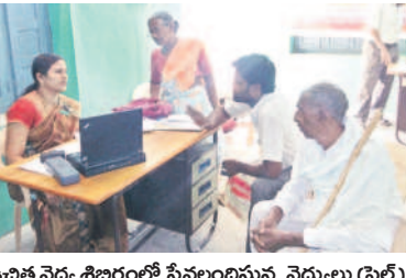
ఉచిత వైద్య శిబిరంలో సేవలందిస్తున్న వైద్యులు (ఫైల్)