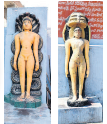
పార్వనాథుడి విగ్రహం బాహుబలి విగ్రహం