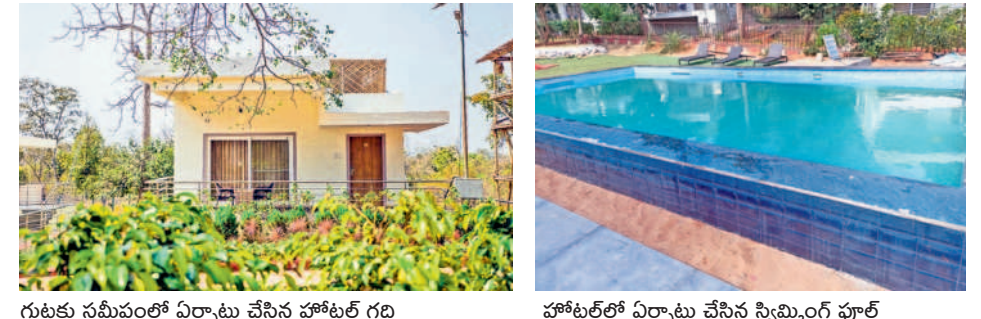
గుట్టకు సమీపంలో ఏర్పాటు చేసిన హోటల్ గది హోటల్లో ఏర్పాటు చేసిన స్విమ్మింగ్ పూల్