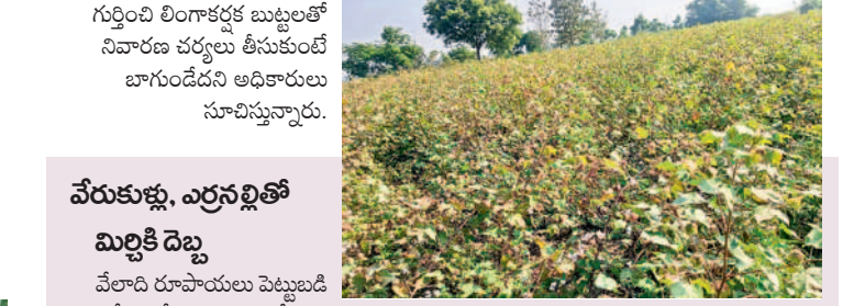
శాయంపేట : గులాబీ పురుగు సాకిన పత్తి పంట

ఇటీవలి వర్షాల కారణంగా పత్తికి తెగుళ్లు ఆశించాయి. గులాబీ రంగు పురుగు తీవ్రంగా దాడి చేస్తున్నది. ఈ క్రమంలో దిగుబడి లేక రైతులు దిగులు చెందుతున్నారు. వేలాది రూపాయలు పెట్టుబడి పెట్టిన రైతులు, ప్రస్తుతం పత్తిని ఏరుతున్నారు. ఎకరాకు రూ.25వేలకుపైగా పెట్టుబడి పెట్టారు. కొందరు రైతులు ఇంకా క్రాప్ శివించి దూదిపై ప్రభావం చూపుతున్నారు. దీంతో చివరకు ఏరేయడం సాహసించడం లేదు. ఎకరాకు 20 క్వింటాళ్ల దిగుబడి వస్తుంది అని ఆశిస్తే చీడపీడలతో తీవ్ర స్వరూపం వస్తోందని అవేదన చెందుతున్నారు. నివారణ కోసం పురుగు మందులు కొట్టినా ఫలితం లేదని మహిళామని చెబుతున్నారు. వ్యవసాయ అధికారులు అందుబాటులో లేక పోవడంతో చీడపీడల నివారణ చర్యలు చేపట్టడం లేదని అంటున్నారు. ఎకరం విస్తీర్ణంలో కనీసం ఐదారు క్వింటాళ్లు కూడా వచ్చే పరిస్థితి లేదని వాపోతున్నారు. ఈ క్రమంలో ముందుగానే గులాబీ రంగు పురుగును గుర్తించి లింగాకర్లక్ బుట్టలతో నివారణ చర్యలు తీసుకుంటే బాగుండేదని అధికారులు సూచిస్తున్నారు.