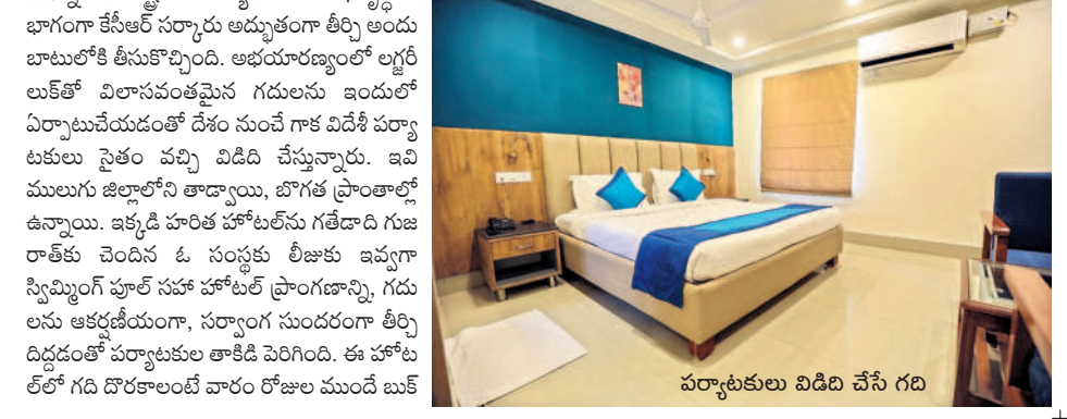
పర్యాటకులు విడిది చేసే గది

చేసుకోవల్సి ఉంటుంది. ప్రకృతిలో అద్భుతంగా ఉన్న ఈ హోటల్ లకు వచ్చేందుకు ఎక్కువగా ఆసక్తి చూపుతున్నారు. అలాగే ఇందులో బర్గర్ పార్టీలు, ఇతర విందులు చేసుకునేందుకు ప్రత్యేక ఏర్పాట్లు చేయడంతో హైదరాబాద్ నుంచి ఇతర నగరాల నుంచి పర్యాటకులు కూకట్‌పల్లికి వస్తున్నారు.