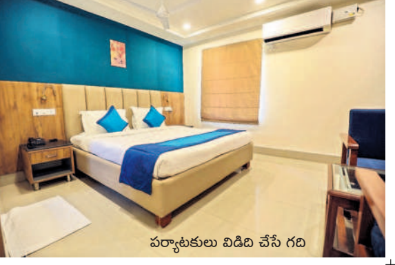
పర్యాటకులు విడిది చేసే గది

తాడ్యాయి, డిసెంబర్ 16 : అద్భుతమైన హంగులతో నిర్మించిన ఫెరియాథో రిసార్ట్లను పర్యాటకులను విశేషంగా ఆకర్షిస్తుంటున్నాయి. రాష్ట్రంలో పర్యాటకరంగా అభివృద్ధిలో భాగంగా కేసీఆర్ సర్కారు అద్భుతంగా తీర్చి అందుబాటులోకి తీసుకొచ్చింది. అభయారణ్యంలో లగ్నర్ లుక్తో విలాసవంతమైన గదులను ఇందులో ఏర్పాటుచేయడంతో దేశం నుంచే గాక విదేశీ పర్యాటకులు సైతం వచ్చి విడిది చేస్తున్నారు. ఇవి ములుగు జిల్లాలోని తాడ్యాయి, బొగక ప్రాంతాల్లో ఉన్నాయి. ఇక్కడి చారిత్రక హోటల్ ను గతదాది గుజరాతీకు చెందిన ఓ సంస్థకు లీజుకు ఇవ్వగా స్విమ్మింగ్ పూల్ సహా హోటల్ ప్రాంగణాన్ని, గదులను ఆకర్షణీయంగా, సర్కారు సుందరంగా తీర్చిదిద్దడంతో పర్యాటకులు తాకిడి పెరిగింది. ఈ హోటల్లో గది నిర్మాణం వారం రోజులు ముందే బుక్ చేసుకోవాలి కంటే ఇప్పుడు ప్రక్కటిలో ఆహ్లాదంగా ఉన్న ఈ హోటల్ లకు వచ్చేందుకు ఎక్కువగా ఆసక్తి చూపుతున్నారు. అలాగే ఇందులో బర్బెడ్ ఫార్మిలు, ఇతర విందులు చేసుకునేందుకు ప్రత్యేక ఏర్పాట్లు చేయడంతో హైదరాబాద్ నుంచి ఇతర నగరాల నుంచి పర్యాటకులు కూకట్ పుట్టుతున్నారు.