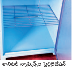
శానిటరీ న్యాప్కిన్స్ ల స్టెరిలిజేషన్