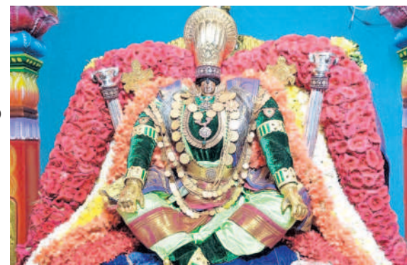
నారసింహావతారంలో దర్శనమిస్తున్న భద్రాద్రి రామయ్య