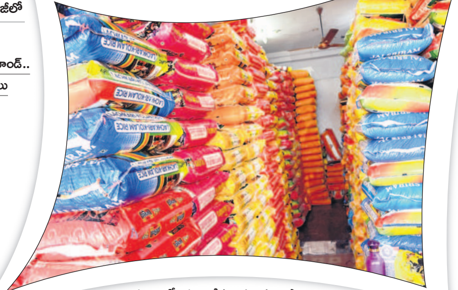
దుకాణంలో అమ్మకానికి ఉంచిన బియ్యం బస్తాలు

- మంచెర్యాల, డిసెంబర్ 16 (నమస్తే తెలంగాణ ప్రతినిధి)