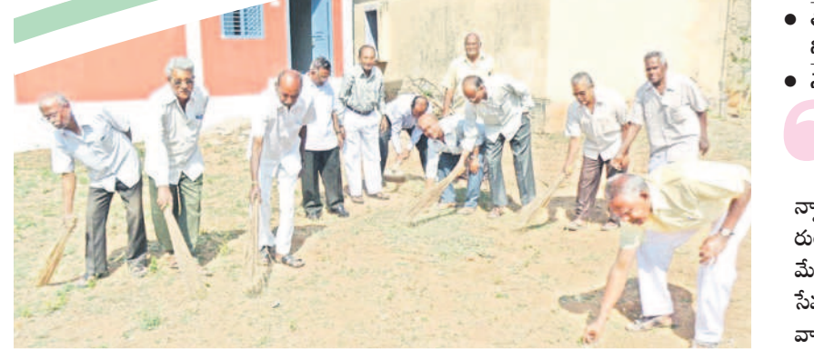
స్వచ్ఛభారత్లో భాగంగా పరిసరాలూ శుభ్రం చేస్తున్న విశ్రాంత ఉద్యోగులు (ఫైల్)

నాగి విగ్రహాలను చెక్కించారని, ప్రాధాన్యతను ఇచ్చారని చెప్పారు. ఈ నేపథ్యంలో నాగులపేట పూర్వకాలం నుంచి మూడు మతాల వారి పోషణలోనూ విలసిల్లి ఉండవచ్చుననే అభిప్రాయాలు వ్యక్తంపడుతున్నాయి. విగ్రహాలు బయటపడుతున్న స్థలానికి కిలోమీటర్ల దూరంలోనే కోరుట్ల పట్టణ పరిధిలో జైన మతానికి సంబంధించిన కళ్యాణి చాళుక్యుల కాలం నాటి రట్ట మార్కాండ దేవాలయం ఉంది. ఈ దేవాలయానికి అనుబంధంగా నిర్మించిన కోనెరులో శైలికృష్ణమల్లప్పడి కాలానికి చెందిన శాసనం ఉంది. ఈ శాసనంలో జైనమతానికి చెందిన ఆలయ నిర్మాణ ప్రస్తావనతో పాటు, జైనమతాచార్యులు (జైన ఫిలాసఫర్స్) ఆలయాలని శ్రాణార్థణ గచ్చ, తిండిగిచ్చల ప్రస్తావనతో పాటు, కొరపట్ల (విద్వావేత్తలు, జ్ఞానశీలులు) వారు చేసే గోస్థి (చర్చ) అంశం వేర్కొనబడింది. అలాగే ఆలయంలో పార్శ్వనాథుడి నిలువెత్తు విగ్రహం, బాహుబలి విగ్రహాలు, జైన ప్రభా మండలాలు ఉన్నాయి. వీటన్నింటినీ పరిశీలించిన చరిత్రకారులు కోరుట్ల రట్ట మార్కాండ ఆలయ ప్రాంతంలో పాటు, నాగులపేట గ్రామం 1500 ఏండ్ల క్రీతమే పెద్ద పట్టణమై ఉండవచ్చుననే అభిప్రాయాలు వ్యక్తంపడుతున్నాయి.