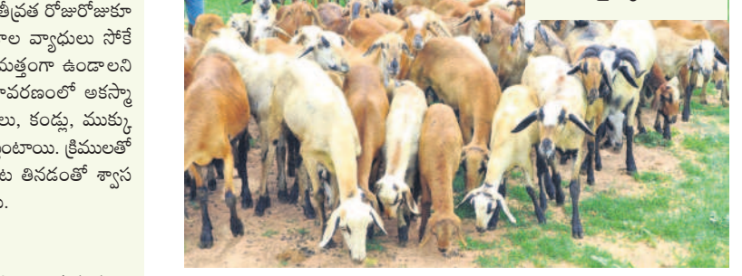
జీవాలు వలె బారినపడకుండా తగిన జాగ్రత్తలు తీసుకోవాలి. జీవాల విషయంలో పెంపకందారులు ఎక్కువగా శ్రద్ధ వహించాలి. పీపీఆర్ (పుల్గు) వైరస్ జీవాలకు సోకా అవకాశం ఉంటుంది. దీని నివారణకు నిర్వహించే చికిత్స లేదు. రోగాలు రాకుండా దీర్ఘకాలంపాటు పనిచేసే అత్రీటిట్రాస్టిన్ వాడొచ్చు. నీరసించిన జీవాలకు గ్లూకోజ్ ఎక్స్ట్రాచ్చు. పెంపకందారులు జీవాల పాకులను శుభ్రంగా ఉంచుకోవాలి. గాలి, వెలుతురు ఉండేలా జాగ్రత్తలు తీసుకుంటే మంచిది.

వ్యాధుల నివారణకు గానూ జీవాలకు గాలి, వెలుతురు సరిగ్గా వచ్చే విధంగా చూడాలి. వాతా వరణం అనుకూలంగా లేనప్పుడు జీవాలను బయటకు వదలకూడదు. పాకులను శుభ్రంగా ఉంచుకోవాలి. వ్యాధులు సోకినప్పుడు పశువైద్యాధికారులను సంప్రదించాలి. చలికాలంలో పీపీఆర్ వ్యాధి సోకిన జీవాల పాలను పెండ్, ముక్క, కండ్ర నుంచి వచ్చే ద్రవాలతో వైద్య మరీచితులకు వ్యాధి చెందే అవకాశం ఉంటుంది. జీవాలకు ముక్కు నుంచి నీళ్లు కారడం ప్రారంభమై, ఒకటి, రెండు రోజుల్లో పీపీఆర్ రూపంలోకి మారుతుంది. కండ్ర ఎర్రబడి నీరు కారుతుంది. నోటి లోపలి పొర దెబ్బతిని, చిగుళ్లు పొర సెక్రేషన్ చెందవచ్చు. ఊపిరితిత్తులకు వ్యాధి సోకడం వల్ల దగ్గు వస్తుంది. దీంతో జీవాలు నీళ్లు పారడంతో మును నాలుగు రోజుల్లోనే చనిపోయే అవకాశం ఉంటుంది. తగిన జాగ్రత్తలు తీసుకోవాలి.