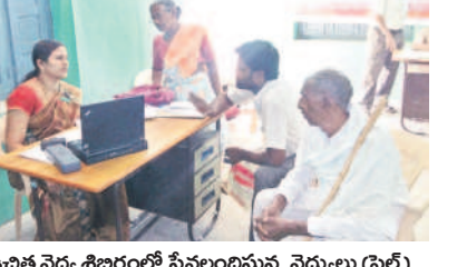
ఉచిత వైద్య శిబిరంలో సేవలందిస్తున్న వైద్యులు (ఫైల్)

సీనియర్ పెన్షనర్లకు సేవలు.. పడవీ విరమణ పొందిన తోటి విశ్రాంత ఉద్యోగులను సన్మానిస్తున్నారు. ఏటా డిసెంబర్ 17న పెన్షనర్ డే సందర్భంగా సంఘంలోని సీనియర్ పెన్షనరులను ముఖ్య సత్కరిస్తున్నారు. ఈ క్రమంలో ఆదివారం నిర్వహించే పెన్షనర్ డే సందర్భంగా విశ్రాంత ఉద్యోగులను అలయ టీఎన్జీవో సంఘంలో నన్నా నించున్నారు.