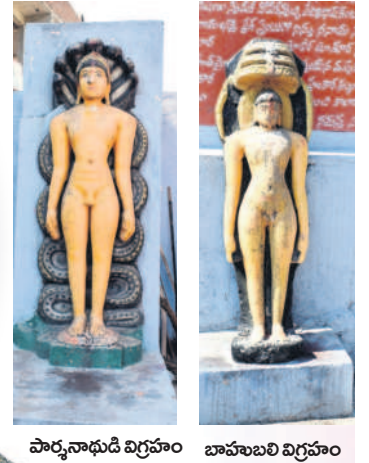
పార్శ్వనాథుడి విగ్రహం బాహుబలి విగ్రహం