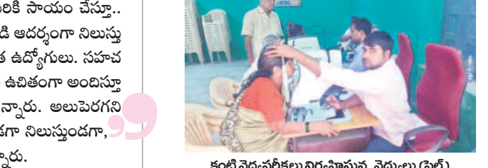
కంటి వైద్యచికిత్సలు నిర్వహిస్తున్న వైద్యులు (ఫైల్)

సీనియర్ పెన్షనర్లకు సేవలు.. పడవీ విరమణ పొందిన తోటి విశ్రాంత ఉద్యోగులను సన్మానిస్తున్నారు. ఏటా డిసెంబర్ 17న పెన్షనర్ డే సందర్భంగా సంఘంలోని సీనియర్ పెన్షనరులను ముఖ్య సత్కరిస్తున్నారు. ఈ క్రమంలో ఆదివారం నిర్వహించే పెన్షనర్ డే సందర్భంగా విశ్రాంత ఉద్యోగులను అలయ టీఎన్జీవో సంఘంలో నన్నా నించున్నారు.