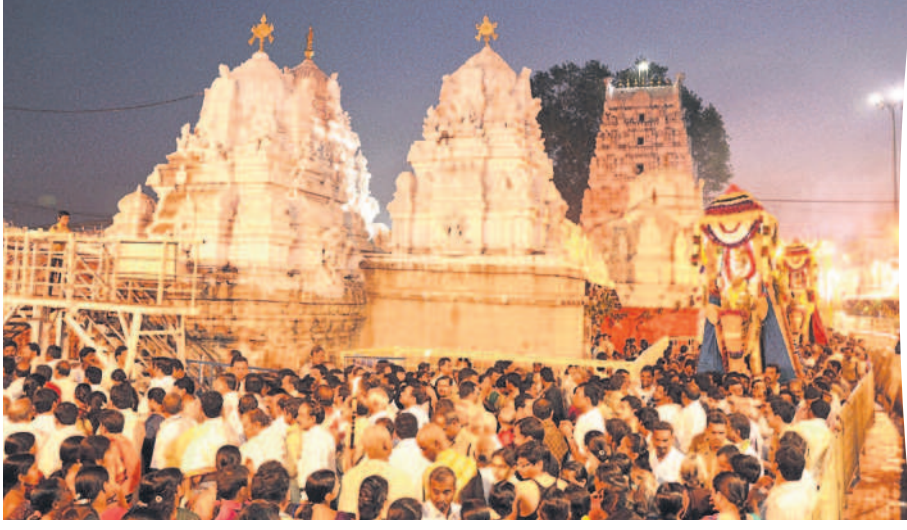
ధనుర్మాసం సందర్భంగా రాజన్న ఆలయంలో ముక్తాశ్రీ ఏకాదశి వేడుకలు (ఫైల్)