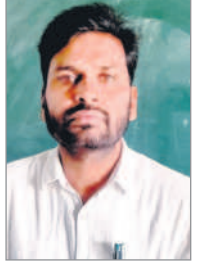
- డాక్టర్ పోతరాజు తిరుపతి, చరిత్రకారుడు