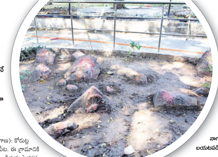
నాగులపేటలో బయటపడిన నాగ ప్రతిమలు