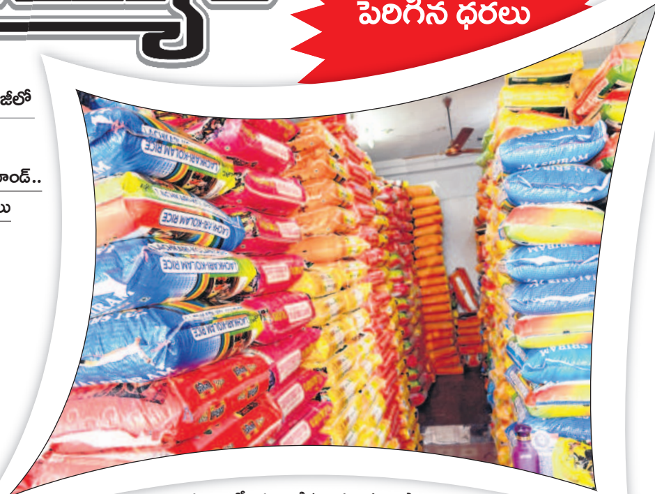
దుకాణంలో అమ్మకానికి ఉంచిన బియ్యం బస్తాలు

- మంచెర్యాల, డిసెంబర్ 16 (నమస్తే తెలంగాణ ప్రతినిధి)