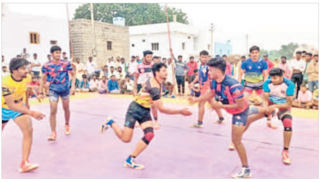
సీమి ఫైనల్లో తలపడుతున్న బెంగుళూరు, కొత్తపల్లి జట్లు