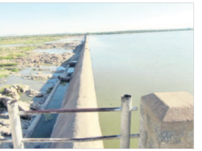
ఆర్డీఎస్ ఆనకట్టలో ప్రస్తుత నీటినిల్వ