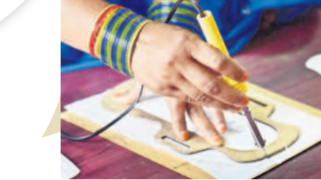
శానిటరీ న్యాప్కిన్స్ ల సైరిలిజేషన్

ప్లాస్టిక్ రహిత ప్రాడక్ట్ ఈ శానిటరీ న్యాప్కిన్స్ పూర్తిగా ప్లాస్టిక్ రహితంగా తయారు చేస్తున్నారు. న్యాప్కిన్స్ ప్యాప్కిన్స్ తో పాటు కర్ర ప్యాకింగ్ పేపర్తో తయారు చేస్తున్నారు. మార్కెట్లో లభిస్తున్న ఖరీదైన కార్పొరేట్ సంస్థలు తయారు చేస్తున్న శానిటరీ న్యాప్కిన్స్ ప్రాడక్ట్లు ప్లాస్టిక్ ప్యాకింగ్ లను వినియోగిస్తున్నారు. లోకల్ బ్రాండ్ మాార్కెట్లోకి వచ్చిన 'చెలి' న్యాప్కిన్స్ ప్యాప్కిన్స్ పూర్తిగా కాంటన్ రూపొందించడం ప్రత్యేకత.