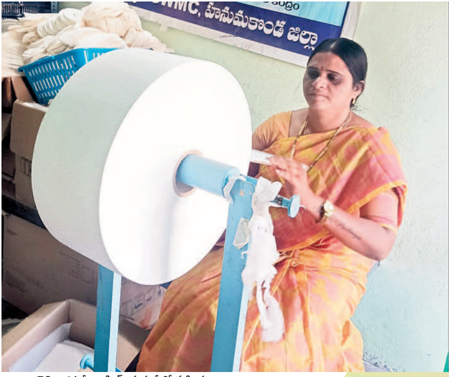
చెలి శానిటరీ న్యాప్కిన్స్ తయారీలో మహిళలు

తయారీలో శిక్షణ గుజరాత్ రాష్ట్రం అహ్మదాబాద్ సంస్థలకు చెందిన శిక్షణ శానిటరీ న్యాప్కిన్స్ తయారీలో శిక్షణ ఇచ్చారు. కొంత మంది మహిళా సంఘం సభ్యులు అహ్మదాబాద్ కు వెళ్లి అక్కడి అర్బన్ మేనేజ్మెంట్ సెంటర్ ఆఫ్ ద్విర్యంలో ఇందులో శిక్షణ తీసుకున్నారు. హైజెనిక్ న్యాప్కిన్స్ ప్యాక్ తయారీలో శిక్షణ పొందిన మహిళలు తమ సొంత పెట్టుబడితో యూనిట్ను ఏర్పాటు చేశారు. మెప్పా అందిస్తున్న సహకారంతో వారు న్యాప్కిన్ తయారీలో తమ దైన ప్రత్యేకతను చాటుకుంటున్నారు.