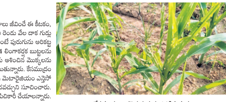
కేసముద్రం : కత్తెర పురుగు సాకిన మక్క