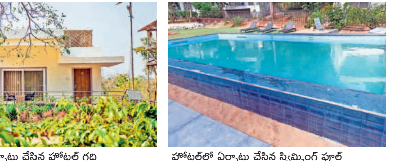
గుట్టకు సమీపంలో ఏర్పాటు చేసిన హోటల్ గది హోటల్లో ఏర్పాటు చేసిన స్విమ్మింగ్ పూల్