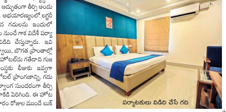
పర్యాటకులు విడిది చేసే గది

తాడ్యాయి, డిసెంబర్ 16 : అద్భుతమైన హంగులతో నిర్మించిన ఫెరియాడార్ రిసార్టులు పర్యాటకులను విశేషంగా ఆకట్టుకుంటున్నాయి. రాష్ట్రంలో పర్యాటకరంగా అభివృద్ధిలో భాగంగా కేసీఆర్ సర్కారు అద్భుతంగా తీర్చి అందుబాటులోకి తీసుకొచ్చింది. అభయారణ్యంలో లగ్నర్ లుక్తో విలాసవంతమైన గదులను ఇందులో ఏర్పాటుచేయడంతో దేశం నుంచే గాక విదేశీ పర్యాటకులు సైతం వచ్చి విడిది చేస్తున్నారు. ఇవి ములుగు జిల్లాలోని తాడ్యాయి, బొగక ప్రాంతాల్లో ఉన్నాయి. ఇక్కడి చారిత్రక హోటల్ ను గతదాది గుజరాతీకు చెందిన ఓ సంస్థకు లీజుకు ఇవ్వగా స్విమ్మింగ్ పూల్ సహా హోటల్ ప్రాంగణాన్ని, గదులను ఆకర్షణీయంగా, సర్కారు సుందరంగా తీర్చిదిద్దడంతో పర్యాటకులు తాకిడి పెరిగింది. ఈ హోటల్లో గది నిర్మాణం వారం రోజులు ముందే బుక్ చేసుకోవాలి కంటే ఇప్పుడు ప్రక్కటిలో ఆహ్లాదంగా ఉన్న ఈ హోటల్ లకు వచ్చేందుకు ఎక్కువగా ఆసక్తి చూపుతున్నారు. అలాగే ఇందులో బర్గర్ పార్టీలు, ఇతర విందులు చేసుకునేందుకు ప్రత్యేక ఏర్పాట్లు చేయడంతో హైదరాబాద్ నుంచి ఇతర నగరాల నుంచి పర్యాటకులు కూకట్ నున్నారు.