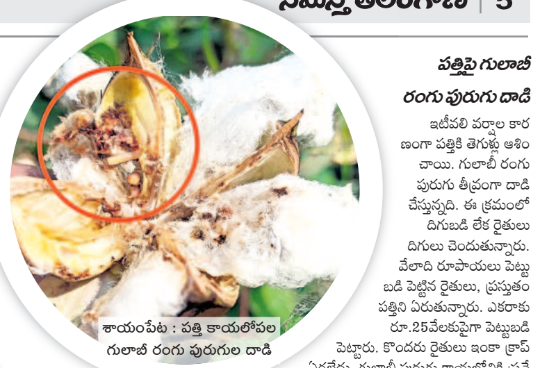
శాయంపేట : పత్తి కాయలోపల గులాబీ రంగు పురుగుల దాడి

పత్తిపై గులాబీ రంగు పురుగు దాడి ఇటీవలి వర్షాల కారణంగా పత్తికి తెగుళ్లు ఆశించాయి. గులాబీ రంగు పురుగు తీవ్రంగా దాడి చేస్తున్నది. ఈ క్రమంలో దిగుబడి లేక రైతులు దిగులు చెందుతున్నారు. వేలాది రూపాయలు పెట్టుబడి పెట్టిన రైతులు, ప్రస్తుతం పత్తిని ఏరుతున్నారు. ఎకరాకు రూ.25వేలకుపైగా పెట్టుబడి పెట్టారు. కొందరు రైతులు ఇంకా క్రాప్ శివించి దూదిపై ప్రభావం చూపుతున్నారు. దీంతో కాయ నల్లబడి ఖాళీ గుల్ల అవుతోంది. కొందరు రైతులు పలు మార్లు పత్తి ఏరినా పురుగు ఆశించిన పంటను ఏరేయకుండా సాహసించడం లేదు. ఎకరాకు 20 క్వింటాళ్ల దిగుబడి వస్తుంది అని ఆశిస్తే చీడపీడలతో తీవ్ర నష్టం వస్తోందని ఆవేదన చెందుతున్నారు. నివారణ కోసం పురుగు మందులు కొట్టినా ఫలితం లేదని మహిళామని చెబుతున్నారు. వ్యవసాయ అధికారులు అందుబాటులో లేక పోవడంతో చీడపీడల నివారణ చర్యలు చేపట్టడం లేదని అంటున్నారు. ఎకరం విస్తీర్ణంలో కనీసం ఐదారు క్వింటాళ్లు కూడా వచ్చే పరిస్థితి లేదని వాపోతున్నారు. ఈక్రమంలో ముందుగానే గులాబీ రంగు పురుగును గుర్తించి లింగాకర్లక్ బుట్టలతో నివారణ చర్యలు తీసుకుంటే బాగుండేదని అధికారులు సూచిస్తున్నారు.