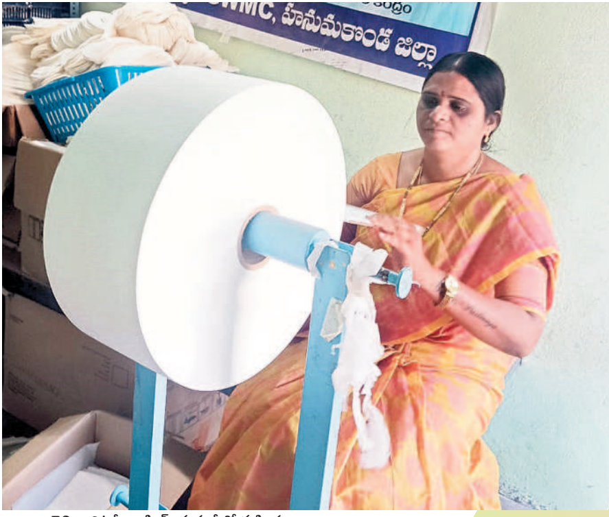
చెలి శానిటరీ న్యాప్కిన్స్ తయారీలో మహిళలు