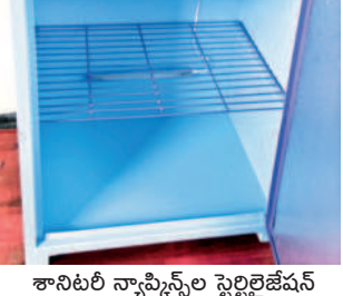
శానిటరీ న్యాప్కిన్స్ల స్టెర్లిలైజేషన్