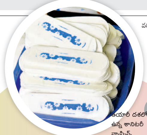
తయారీ దశలో ఉన్న శానిటరీ న్యాప్కిన్స్