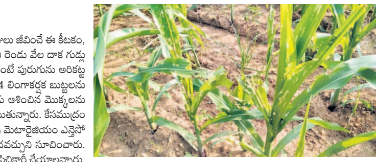
కేసముద్రం : కత్తెర పురుగు సాకిన మక్క