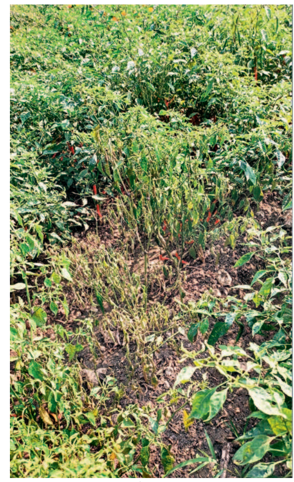
మక్కకు 'కత్తెర' శాయంపేట : వేరుకుళ్లు రోగంతో ఎండిపోయిన మిల్లి