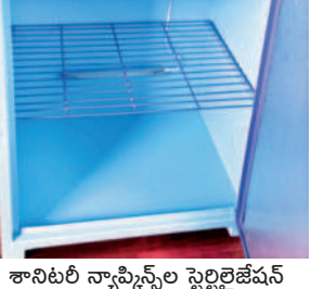
శానిటరీ న్యాప్కిన్స్ల స్టెర్లిలైజేషన్

ప్రభుత్వ సంస్థలు సహకరించాలి సొంత పెట్టుబడితో ఉపాధి రంగాల్లో అడుగు పెట్టిన మహిళా ప్రభుత్వం చేయూత అందించాలి. ప్రభుత్వం చెలి హైజెనిక్ ప్రాడక్టుల కొనుగోలు చేయాలి. ప్రభుత్వ సంక్షేమ హాస్యక విద్యార్థినులకు వీటిని అందించేలా ఆవకాశం కల్పించాలి. ప్రభుత్వం చేయూత అందిస్తే మరింత అభివృద్ధిలో ముందుకు వెళ్తాం. ప్రభుత్వం రూణ సహాయం అందిస్తే మరింత మందికి ఉపాధి కల్పించి వ్యాపారాన్ని మరింత విస్తరిస్తాం. భవిష్యత్లో 20వేల ప్యాకెట్లను తయారు చేయడమే లక్ష్యంగా పెట్టుకున్నాం. రాబోయే రోజుల్లో మహిళలకు న్యాప్కిన్ తయారీలో శిక్షణ ఇస్తాం. ప్రస్తుతం ప్రాడక్ట్ మార్కెటింగ్ చేయడంపై ప్రత్యేక దృష్టి సాటిస్తున్నాం. షాపింగ్ మాల్స్లో మార్కెటింగ్ కోసం కృషి చేస్తున్నాం. ఇందుకు కార్పొరేషన్, మెప్పా అధికారులు చేయూత అందిస్తే మార్కెటింగ్లో మరింత ముందుకు పోతాం.