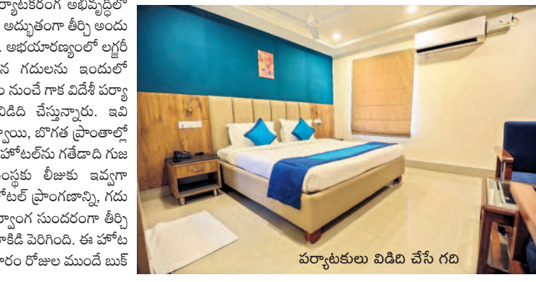
పర్యాటకులు విడిది చేసే గది

తాడ్యాయి, డిసెంబర్ 16 : అద్భుత హోటల్ నిర్మాణం విన ఫెరియాడో రిసార్ట్లను పర్యాటకులను విశేషంగా ఆకర్షిస్తుంటున్నాయి. రాష్ట్రంలో పర్యాటకరంగా అభివృద్ధిలో భాగంగా కేసీఆర్ సర్కారు అద్భుతంగా తీర్చి అందుబాటులోకి తీసుకొచ్చింది. అభయారణ్యంలో లగ్నర్ లుక్తో విలాసవంతమైన గదులను ఇందులో ఏర్పాటుచేయడంతో దేశం నుంచే గాక విదేశీ పర్యాటకులు సైతం వచ్చి విడిది చేస్తున్నారు. ఇవి ములుగు జిల్లాలోని తాడ్యాయి, బొగక ప్రాంతాల్లో ఉన్నాయి. ఇక్కడి హరిత హోటల్ ను గతదాది గుజరాతీకు చెందిన ఓ సంస్థకు లీజుకు ఇవ్వగా స్విమ్మింగ్ పూల్ సహా హోటల్ ప్రాంగణాన్ని, గదులను ఆకర్షణీయంగా, సర్కారు సుందరంగా తీర్చిదిద్దడంతో పర్యాటకులు తాకిడి పెరిగింది. ఈ హోటల్లో గది నిర్మాణం వారం రోజులు ముందే బుక్ చేసుకోవాలి కంటే ఇప్పుడు ప్రక్కటిలో ఆహ్లాదంగా ఉన్న ఈ హోటల్ లకు వచ్చేందుకు ఎక్కువగా ఆసక్తి చూపుతున్నారు. అలాగే ఇందులో బర్బెడ్ ఫార్మిలు, ఇతర విందులు చేసుకునేందుకు ప్రత్యేక ఏర్పాట్లు చేయడంతో హైదరాబాద్ నుంచి ఇతర నగరాల నుంచి పర్యాటకులు కూకట్ పుచ్చుతున్నారు.