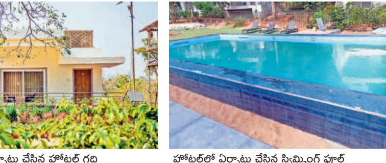
గుట్టకు సమీపంలో ఏర్పాటు చేసిన హోటల్ గది హోటల్లో ఏర్పాటు చేసిన స్విమ్మింగ్ పూల్