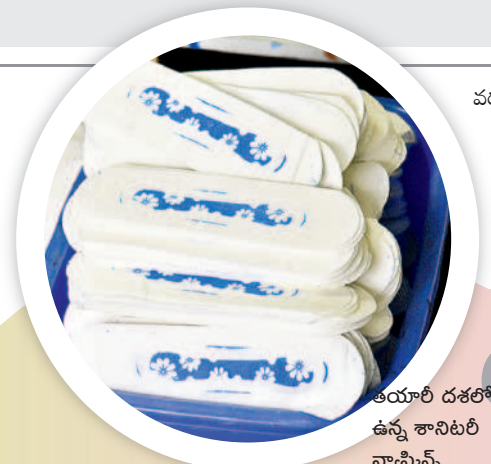
తయారీ దశలో ఉన్న శానిటరీ న్యాప్కిన్స్