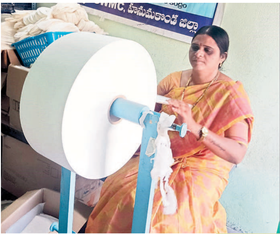
చెలి శానిటరీ న్యాప్కిన్స్ తయారీలో మహిళలు