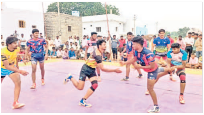
సెమీ ఫైనల్ లో తలపడుతున్న బెంగుళూరు, కొత్తపల్లి జట్లు

నారాయణపేట, డిసెంబర్ 16 : పట్టణంలోని వ్యవసాయ మార్కెట్ యార్డులో శనివారం 987 క్వీంటాళ్ల సోన రకం ధాన్యం విక్రయానికి రాగా క్వీంటా గరిష్టంగా రూ. 3,423, కనిష్టంగా 1,876 ధర పలికింది. 36 క్వీంటాళ్ల హంసధాన్యం విక్రయానికి రాగా క్వీంటా గరిష్టంగా రూ. 2,019 కనిష్టంగా 1,519 ధర పలికింది. 891 క్వీంటాళ్ల ఎర్రకందులు విక్రయానికి రాగా క్వీంటా గరిష్టంగా రూ. 11,209, కనిష్టంగా రూ. 3,729 ధర పలికింది. 348 క్వీంటాళ్ల తెల్ల కందులు విక్రయానికి రాగా క్వీంటా గరిష్టంగా రూ. 11,255, కనిష్టంగా రూ. 9,022 ధర పలికినట్లు యార్డు పర్యవేక్షకుడు లక్ష్మణ్ తెలిపారు. 511 క్వీంటాళ్ల పత్తి అమ్మకానికి రాగా గరిష్టంగా రూ. 6,899 ధర పలికింది.