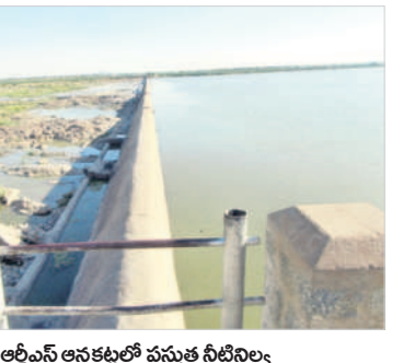
ఆర్డిఎస్ ఆనకట్టలో ప్రస్తుత నీటినిల్వ