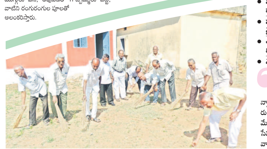
స్వచ్ఛభారత్ లో భాగంగా పరిసరాలూ శుభ్రం చేస్తున్న విశ్రాంత ఉద్యోగులు (ఫైల్)

వేములవాడ, డిసెంబర్ 16: పడవీ విరమణ అంటే బాధ్యతలో నుంచి తప్పుకోని ప్రశాంతంగా జీవించడమే అనేది అందరికీ తెలిసిన సత్యం. కానీ, వేములవాడ పట్టణంలోని విశ్రాంత ఉద్యోగులు మలిదశలోనూ సులుగురికి సాయం చేస్తున్నారు. సహచరులకు అవసరమైన సేవలను అందిస్తూ, వారికి అన్నివిధాలా అండగా ఉంటున్నారు.