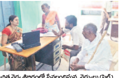
ఉచిత వైద్య శిబిరంలో సేవలందిస్తున్న వైద్యులు (ఫైల్)