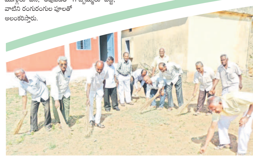
స్వచ్ఛభారత్ లో భాగంగా పరిసరాలూ శుభ్రం చేస్తున్న విశ్రాంత ఉద్యోగులు (ఫైల్)