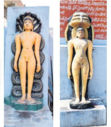
పార్వనాథుడి విగ్రహం బాహుబలి విగ్రహం