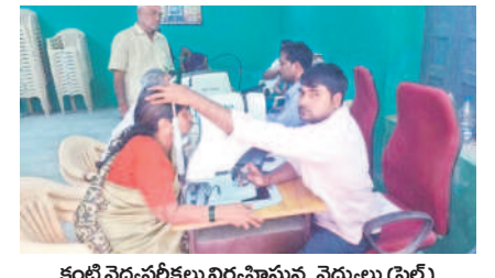
కంటి వైద్యచికిత్సలు నిర్వహిస్తున్న వైద్యులు (ఫైల్)

మలిదశలోనూ సలుగురికి సాయం చేస్తూ.. సామాజిక సేవలో ముందుండి ఆదర్శంగా నిలుస్తున్నారని వేములవాడలోని విశ్రాంత ఉద్యోగులు. సహచరులకు అవసరమైన వైద్య సేవలు ఉచితంగా అందిస్తూ మేమున్నామంటూ భరోసానిస్తున్నారు. అలుపెరగని సేవలందిస్తూ.. తోటివారికి అండగా నిలుస్తుండగా, వారిని పలువురు అభినందిస్తున్నారు. సామాజిక సేవలోనే ముందడుగు.. కేంద్ర, రాష్ట్ర ప్రభుత్వాలకు నిర్వహించిన స్వచ్ఛభారత్ లో కూడా విశ్రాంత ఉద్యోగులు తమ వంతు కృషి చేశారు. ప్రజలను చైతన్యం చేయడమే కాకుండా, వారు కూడా స్వచ్ఛత కార్యక్రమాల్లో భాగస్వాములయ్యారు. అలాగే విశ్రాంత ఉద్యోగులకు ఉచితంగా వైద్య సేవలు అందిస్తూ ఆదర్శంగా నిలుస్తున్నారు. ఇప్పటికే 40సార్లు వేములవాడ పట్టణంలో ఉచిత వైద్య శిబిరాలు ఏర్పాటు చేశారు. ఉప్పు గడ్డ అంజనయస్వామి ఆలయ టీఎన్టీవో భవనంలో ఈ వైద్య శిబిరాలను ఏర్పాటు చేస్తూ, అవసరమైన వారికి ఉచితంగా మందులు అందిస్తున్నారు. దాదాపు 300 మందికి కంటికి సంబంధించిన శస్త్ర చికిత్సలు చేయించారు.