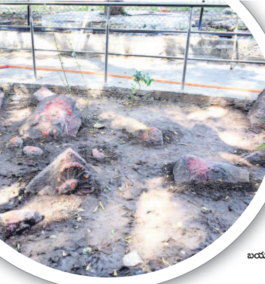
నాగులపేటలో బయటపడిన నాగ ప్రతిమలు