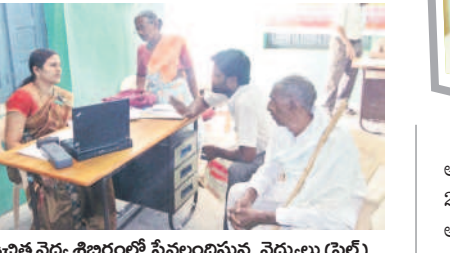
ఉచిత వైద్య శిబిరంలో సేవలందిస్తున్న వైద్యులు (ఫైల్)