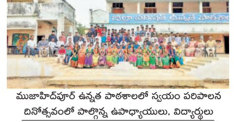
ముజాహిద్ పూర్ ఉన్నత పాఠశాలలో స్వయం పరిపాలన దినోత్సవంలో పాల్గొన్న ఉపాధ్యాయులు, విద్యార్థులు