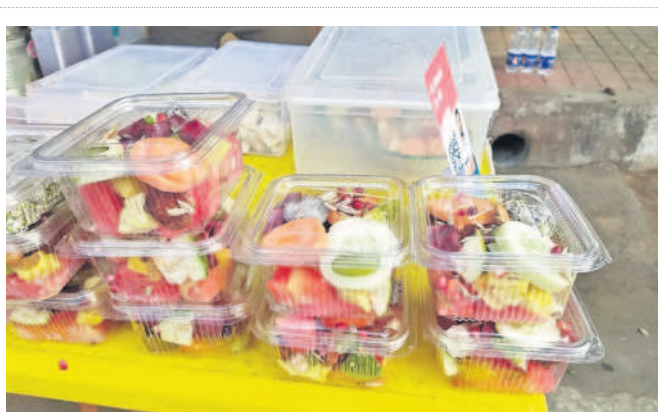
సిద్దిపేట పట్టణంలోని హెడ్ పోస్టాఫీసు వద్ద ఏర్పాటు చేసిన మార్కెటింగ్ ట్రూట్స్ స్టాల్, వివిధ రకాల ఫ్రూట్స్, డ్రైఫ్రూట్స్