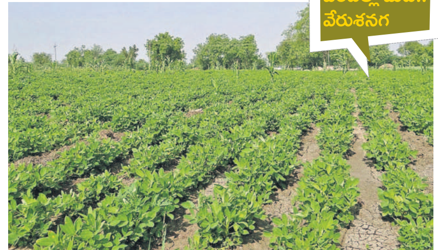
హుస్సాబాద్ మండలంలో సాగు చేసిన వేరుశనగ పంట

హుస్సాబాద్, డిసెంబర్ 16: ఆరుతడి పంటల్లో వేరుశనగ పంట(పల్లి కాదు) ప్రధాన మైనదిగా చెప్పొచ్చు. నూనె గింజల పంటల్లోనూ వేరుశనగకు ప్రత్యేక స్థానం ఉంది. ప్రస్తుతం పల్లి నూనెకు ఉన్న గిరాకీ అంతా ఇంతా కాదు. మార్కెట్లో పల్లి నూనెకు ఉన్న గిరాకీని దృష్టిలో ఉంచుకొని యాసంగిలో వేరుశనగ పంటను సాగు చేస్తే అధిక లాభాలు వస్తాయని వ్యవసాయాధికారులు, ఆర్థిక నిపుణులు సూచిస్తున్నారు. సిద్దిపేట జిల్లాలోని దాదాపు అన్ని మండలాల్లో వేరుశనగ పంటను సాగు చేసుకునేందుకు అనువైన భూములు ఉన్నాయి. ఇసుకతో కలిపి ఉన్న భూములలో పాటు ఎర్రచెల్లె భూములు అధికంగా ఉన్నాయి. జిల్లాలో వరి పంటకు ప్రత్యామ్నాయంగా వేరుశనగ పంటను సాగు చేస్తే అధిక దిగుబడి వస్తుందని నిపుణులు పేర్కొంటున్నారు. ఆరుతడి పంటలను సాగు చేయాలని ప్రభుత్వాలూ సూచిస్తున్న తరుణంలో రైతులు ఈ పంటను సాగు చేసేందుకు ముందు కొస్తున్నారు.