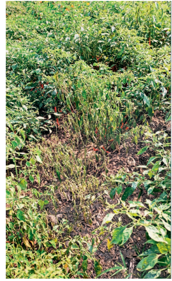
మక్కకు 'కత్తెర' శాయంపేట : వేరుకుళ్లు రోగంతో ఎండిపోయిన మిల్లి

మక్క పంటకు కత్తెర పురుగు తీవ్ర నష్టం కలిగిస్తుంది. ఎండాకాలంలో 90 రోజులు జీవించే ఈ కీటకం, చలికాలంలో 3 నెలల పాటు బతికి ఉంటుంది. ఒక్కో ఆడ పురుగు 1500 నుంచి రెండు వేల దాక గుడ్లు పెడుతూ సంవత్సరం వేగంగా విస్తరించజేస్తుంది. సవైన సస్య రక్షణ చర్యలు తీసుకుంటే పురుగును అరికట్ట వచ్చని వ్యవసాయ శాస్త్రవేత్తలు సూచిస్తున్నారు. పంట విత్తిన వెంటనే ఎకరానికి 4 లింగాకర్లక్ బుట్టలను అమర్చి పురుగు ఉనికిని గమనించాలని, చేను నలుమూలలా పరిశీలించి పురుగు ఆశించిన మొక్కలను గుర్తించాలని, అలస్యంగా సాగు చేసిన మక్కను పురుగు ఎక్కువగా ఆశిస్తుందిని చెబుతున్నారు. కేసముద్రం మండల వ్యవసాయాధికారి వెంకట్రావు మాట్లాడుతూ పంట సాగు చేసిన నెల లోపు మెట్టారైజియం ఎస్టేట్ ప్రియో 5 గ్రామాలను లీటర్ నీటిలో కలిపి పిచికారీ చేస్తే లార్గా దళను నివారించవచ్చని సూచించారు. ఇన్సెక్టికార్డ్, ల్యాండాస్లిలిస్, సైయినోస్టెడ్, మిథాక్స్సిప్రోజెడ్ వంటి వాటిని పిచికారీ చేయాలన్నారు. గ్రామం లార్గిన్ ను లీటర్ నీటిలో నీమె అయిల్ ను కలిపి పిచికారీ చేస్తే ఫలితం ఉంటుందన్నారు.