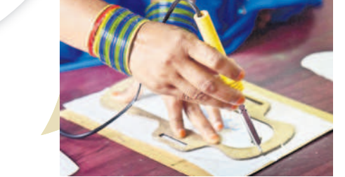
శానిటరీ న్యాప్కిన్స్ల సైరిలిజేషన్

ప్లాస్టిక్ రహిత ప్రాడక్ట్ ఈ శానిటరీ న్యాప్కిన్స్ పూర్తిగా ప్లాస్టిక్ రహితంగా తయారు చేస్తున్నారు. న్యాప్కిన్స్ ప్యాప్కిన్తో పాటు కర్ర ప్యాకింగ్ పేపర్తో తయారు చేస్తున్నారు. మార్కెట్లో లభిస్తున్న ఖరీదైన కార్పొరేట్ సంస్థలు తయారు చేస్తున్న శానిటరీ న్యాప్కిన్స్ ప్రాడక్ట్లు ప్లాస్టిక్ ప్యాకింగ్లను వినియోగిస్తున్నారు. లోకల్ బ్రాండ్గా మార్కెట్లోకి వచ్చిన 'చెలి' న్యాప్కిన్స్ ప్యాప్కిన్స్ పూర్తిగా కాంటన్ రూపొందించడం ప్రత్యేకత.