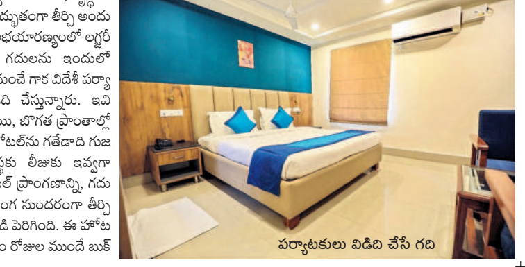
పర్యాటకులు విడిది చేసే గది

తాడ్యాయి, డిసెంబర్ 16 : అధునాతన హంగులతో నిర్మించిన ఫెరియాడో రిసార్ట్లు పర్యాటకులను విశేషంగా ఆకర్షిస్తుంటున్నాయి. రాష్ట్రంలో పర్యాటకరంగా అభివృద్ధిలో భాగంగా కేసీఆర్ సర్కారు అద్భుతంగా తీర్చి అందుబాటులోకి తీసుకొచ్చింది. అభయారణ్యంలో లగ్నర్ లుక్తో విలాసవంతమైన గదులను ఇందులో ఏర్పాటుచేయడంతో దేశం నుంచే గాక విదేశీ పర్యాటకులు సైతం వచ్చి విడిది చేస్తున్నారు. ఇవి ములుగు జిల్లాలోని తాడ్యాయి, బొగక ప్రాంతాల్లో ఉన్నాయి. ఇక్కడి చారిత్రక హోటల్ ను గతదాది గుజరాతీకు చెందిన ఓ సంస్థకు లీజుకు ఇవ్వగా స్వీమ్మింగ్ పూల్ సహా హోటల్ ప్రాంగణాన్ని, గదులను ఆకర్షణీయంగా, సర్కారు సుందరంగా తీర్చిదిద్దడంతో పర్యాటకులు తాకిడి పెరిగింది. ఈ హోటల్లో గడి రెండుకాలం వారం రోజులు ముందే బుక్ చేసుకోవాలి ఉంటుంది. ప్రకృతిలో ఆహ్లాదంగా ఉన్న ఈ హోటల్ కు వచ్చేందుకు ఎక్కువగా ఆసక్తి చూపుతున్నారు. అలాగే ఇందులో బర్బెడ్ ఫార్మీలు, ఇతర విందులు చేసుకునేందుకు ప్రత్యేక ఏర్పాట్లు చేయడంతో హైదరాబాద్ నుంచి ఇతర నగరాల నుంచి పర్యాటకులు కూకట్ పుచ్చుతున్నారు.