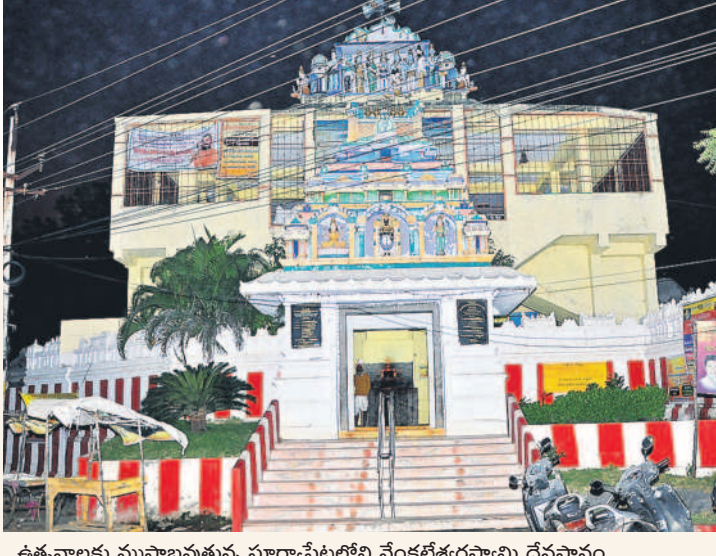
ఉత్సవాలకు ముస్తాబవుతున్న సూర్యాపేటలోని వేంకటేశ్వరస్వామి దేవస్థానం

గోదా ఆషాఢాశ్రమ శత నామాలతో అర్చన చేసి మొదటి రోజు టింకాయ కొట్టి తీపి వంటల నైవేద్యం ఉంచి హరతి ఇవ్వాలి. సాయంత్రం దీపారాధన చేసి వీలుంటే గోదా ఆషాఢాశ్రమ చదువాలి. ఇలా బోగి పండుగ వరకు 30 రోజులు వ్రతం చేయాలి. ఈ వ్రతం ఆచరించే వారు ఆండాళ్ ఆమ్మవారి ముమ్మై పోశురములు (తిరుప్పావై) చదువాలి. బోగి రోజు తీపి వంటల చక్కెర పొంగలిని ప్రసాదంగా సమర్పించాలి. వ్రతం ఆచరించే వారు ఒంటి పూట భోజనంతోపాటు నాత్మిక ఆహారాన్ని తీసుకోవాలి.