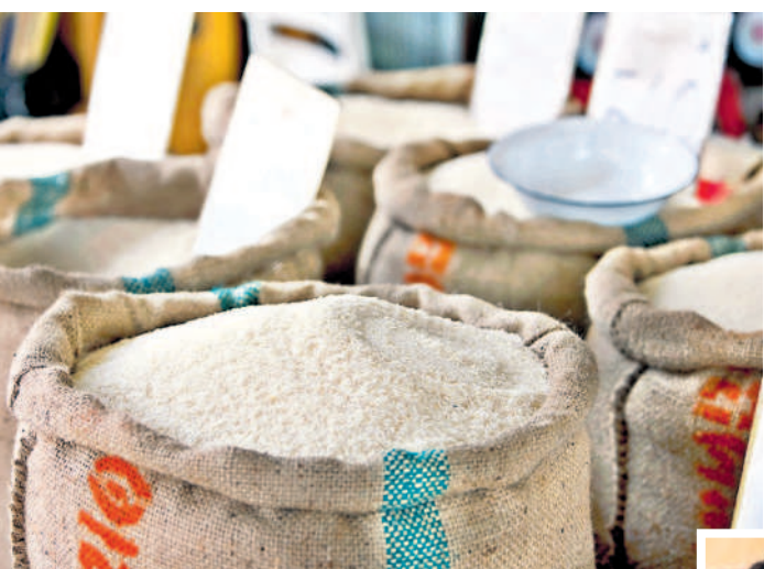
తగ్గిన సన్నాల సాగు..

నల్లగొండ, డిసెంబర్ 16 : సన్న బియ్యం ధరలు సామాన్యూడి అంచనాలు మించి మార్కెట్ లో సన్నాయి మోత మోగుతున్నాయి. గడిచిన నాలుగైదేండ్లుగా ఏటా వానకాలం సీజన్ లో మిల్లుల వద్ద క్వింటా బియ్యం రూ.3వేల నుంచి రూ.3500 వరకు ధారితేది. ఈ ఏడాది గత పరిస్థితులకు భిన్నంగా వాటి ధరలు మార్కెట్ లో దర్భరమిస్తున్నాయి. రైస్ దుకాణాలతో పాటు మిల్లుల్లో ప్రస్తుతం టీవీటీ కొత్త బియ్యం క్వింటా రూ.4800 నుంచి రూ.5వేల వరకు అమ్ముతుండగా.. పాతవి (గత వానకాలం)