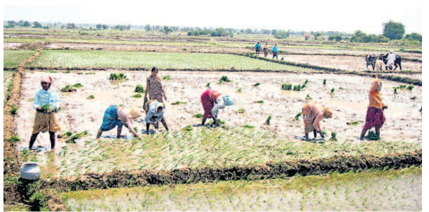
అనుముల మండలం మదారిగూడెం వద్ద యాసంగి వరి నాట్లు వేస్తున్న కూలీలు