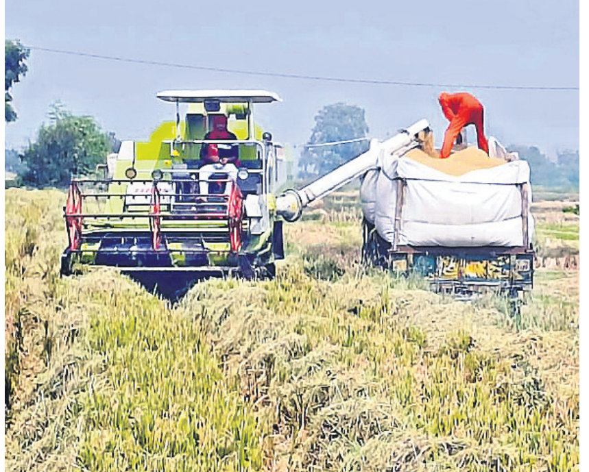
అనుముల మండలం పేరూరు వద్ద వానకాలం వరి కోతలు

హాలియా, డిసెంబర్ 16 : నాగార్జున సాగర్ నియోజకవర్గంలో రైతులు, కూలీలు సాగు పనుల్లో బిజీబిజీగా ఉన్నారు. వానకాలం ముగిసి యాసంగి సీజన్ సుస్థుల పంటలు వేశారు. గత ఏడాది యాసంగిలో కోతలు కోస్తుండగా.. మరోవైపు నాట్లు వేస్తున్న పరిస్థితి ఉన్నది. ఈ ఏడాది నాగార్జున సాగర్ ఎడమ కాల్వలకు సాగు నీటిని విడుదల చేయలేమని, రైతులు ట్రాప్ హాలిడే అవకాశం ఉన్నది.