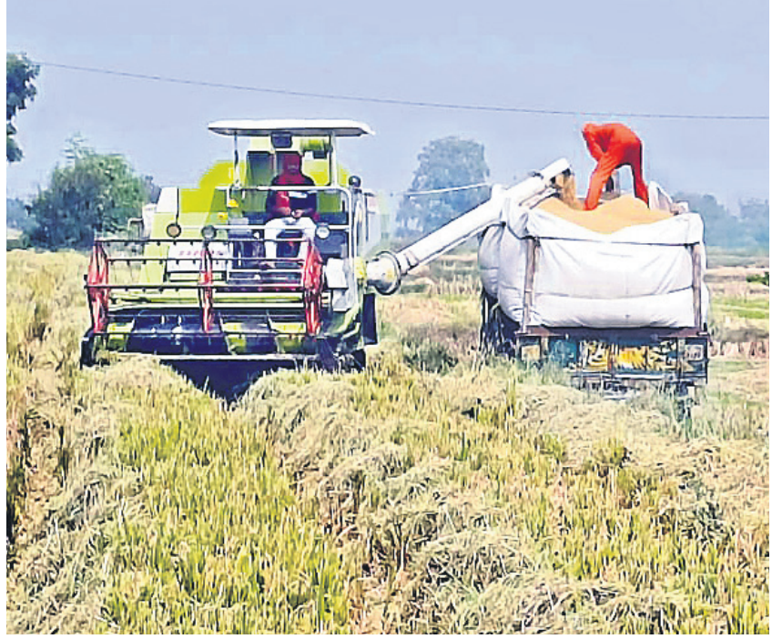
అనుముల మండలం పేరూరు వద్ద వానకాలం వరి కోతలు

హాలియా, డిసెంబర్ 16 : నాగార్జున సాగర్ నియోజకవర్గంలో రైతులు, కూలీలు సాగు పనుల్లో బిజీబిజీగా ఉన్నారు. వానకాలం ముగిసి యాసంగి సీజన్ సుస్థుల పంటలు వేశారు. గత ఏడాది యాసంగిలో కోతలు కోస్తుండగా.. మరోవైపు నాట్లు వేస్తున్న పరిస్థితి ఉన్నది. ఈ ఏడాది నాగార్జున సాగర్ ఎడమ కాల్వకు సాగు నీటిని విడుదల చేయలేమని, రైతులు ట్రాప్ హాల్ డి అవకాశం ఉన్నది.