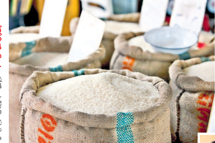
తగ్గిన సన్నాల సాగు..

నల్లగొండ, డిసెంబర్ 16 : సన్న బియ్యం ధరలు సామాన్యూడి అంచనాలు మించి మార్కెట్ లో సన్నాయి మోత మోగుతున్నాయి. గడిచిన నాలుగైదేండ్లుగా ఏటా వానకాలం సీజన్ లో మిల్లుల వద్ద క్వింటా బియ్యం రూ.3వేల నుంచి రూ.3500 వరకు ధారితేది. ఈ ఏడాది గత పరిస్థితులకు భిన్నంగా వాటి ధరలు మార్కెట్లో దర్భరమిస్తున్నాయి. రైస్ దుకాణాలతో పాటు మిల్లుల్లో ప్రస్తుతం టీవీటీ కొత్త బియ్యం క్వింటా రూ.4800 నుంచి రూ.5వేల వరకు అమ్ముతుండగా.. పాతవి (గత వానకాలం)