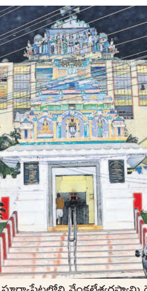
ఉత్సవాలకు ముస్తాబవుతున్న సూర్యాపేటలోని వేంకటేశ్వరస్వామి దేవస్థానం

సాక్షాత్తు భూదేవి అవతారమూర్తి అయిన ఆండాళ్ రచించిన దివ్య ప్రబంధమే తిరుప్పావై. తిరుప్పావై అంటే శ్రీవ్రతం. ఈ వ్రతాన్ని తిరునామం అంటారు. తిరు అంటే మంగళకరం, పావై అంటే మేల్కొలుపు అని అర్థం. ఈ మాసంలో విష్ణువును మధుసూదనుడు పేరుతో పూజించి మొదటి 15 రోజులు చక్కెర పొంగలి లేదా పులగం నైవేద్యంగా సమర్పించాలి.