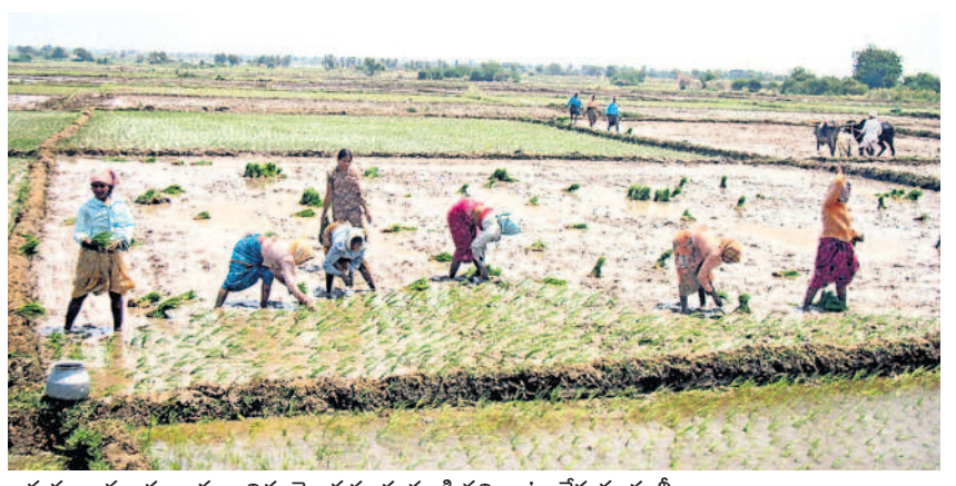
అనుముల మండలం మదారిగూడెం వద్ద యాసంగి వరి నాట్లు వేస్తున్న కూలీలు