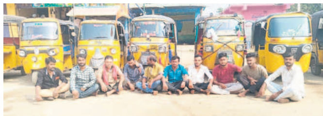
దహెగాం మండల కేంద్రంలో రోడ్డుపై బైరాయించిన ఆటో డ్రైవర్లు