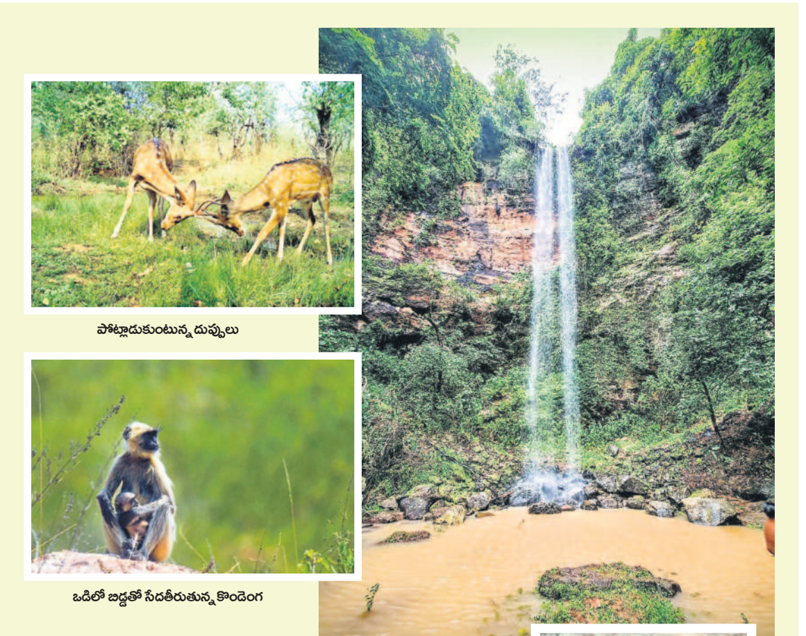
పోట్లాడుకుంటున్న దుప్పలు, ఒడిలో బద్దతో సేద్యం చేస్తున్న కొండెం

అసిఫాబాద్ జిల్లాలోని రెవెన్యూ, సిర్కార్-టీ, దహాంగం, కెరమెరి, తిర్నాటి మండలాల్లో రైతులు ఎక్కువగా పండ్లతోటలపై ఆసక్తి చూపిస్తున్నారు. పండ్లతోటల పెంపకానికి ముందుకు వచ్చే రైతులకు ఉద్యానవన శాఖ మూడేళ్ల వరకు రాయితీ అందించనున్నది. మామిడి సాగుచేసే రైతులకు ఎకరానికి రూ. 58,452, జామకు రూ. 76,112, సంత సాగుకు రూ. 76,071, దానిమ్మ సాగుకు రూ. 91,474, బత్తాయి సాగుకు రూ. 89,547, సీతాఫలాలకు రూ. లక్ష, సపోకుకు రూ. 49,551, నేరేడుకు రూ. 31,719లను సంబంధిత శాఖ మూడేళ్ల వరకు రాయితీ అందిస్తుంది. సూక్ష్మసేద్య పథకం ద్వారా జిల్లాలో ఎన్నో ఎన్నో రైతులకు 100 శాతం రాయితీని సేద్యపు పరికరాలను కూడా అందించేందుకు చర్యలు చేపట్టింది. మరోవైపు పండ్లతోటల పెంపకంలో పాటు అటవీ జాతి మొక్కల పెంపకంపై ఆసక్తి ఉన్న రైతులకు కూడా రాయితీలు ఇస్తున్నది.