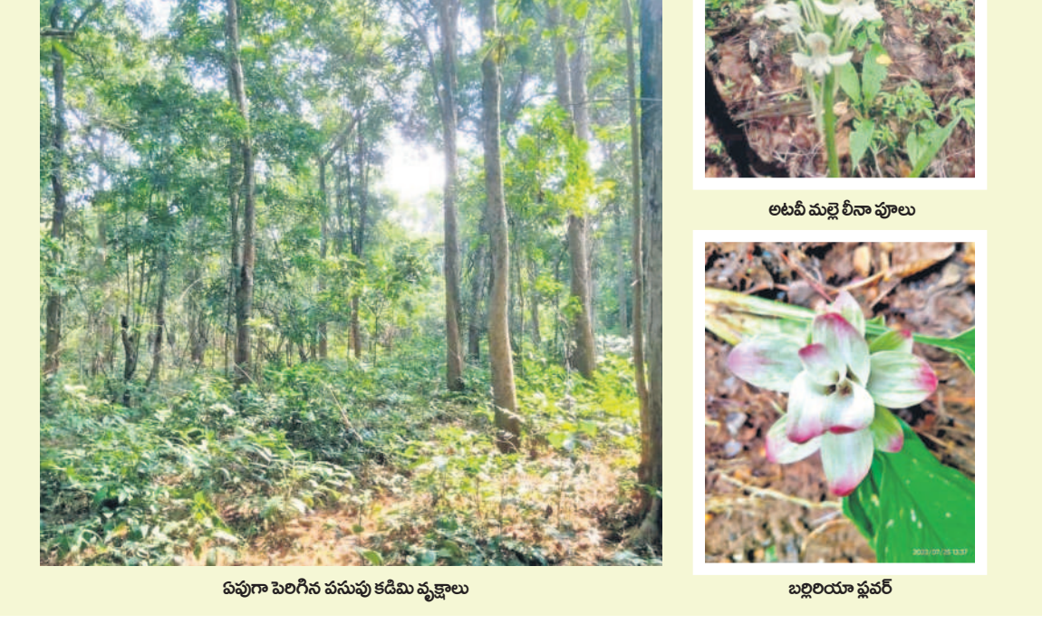
బొప్పాయి పండ్లను పనుచు కడిమి వృక్షాలు, బద్దెయ్యి ప్లవర్

అసిఫాబాద్ జిల్లాలోని రెవెన్యూ, సిర్కార్-టీ, దహాంగం, కెరమెరి, తిర్నాటి మండలాల్లో రైతులు ఎక్కువగా పండ్లతోటలపై ఆసక్తి చూపిస్తున్నారు. పండ్లతోటల పెంపకానికి ముందుకు వచ్చే రైతులకు ఉద్యానవన శాఖ మూడేళ్ల వరకు రాయితీ అందించనున్నది. మామిడి సాగుచేసే రైతులకు ఎకరానికి రూ. 58,452, జామకు రూ. 76,112, సంత సాగుకు రూ. 76,071, దానిమ్మ సాగుకు రూ. 91,474, బత్తాయి సాగుకు రూ. 89,547, సీతాఫలాలకు రూ. లక్ష, సపోకుకు రూ. 49,551, నేరేడుకు రూ. 31,719లను సంబంధిత శాఖ మూడేళ్ల వరకు రాయితీ అందిస్తుంది. సూక్ష్మసేద్య పథకం ద్వారా జిల్లాలో ఎన్నో ఎన్నో రైతులకు 100 శాతం రాయితీని సేద్యపు పరికరాలను కూడా అందించేందుకు చర్యలు చేపట్టింది. మరోవైపు పండ్లతోటల పెంపకంలో పాటు అటవీ జాతి మొక్కల పెంపకంపై ఆసక్తి ఉన్న రైతులకు కూడా రాయితీలు ఇస్తున్నది.