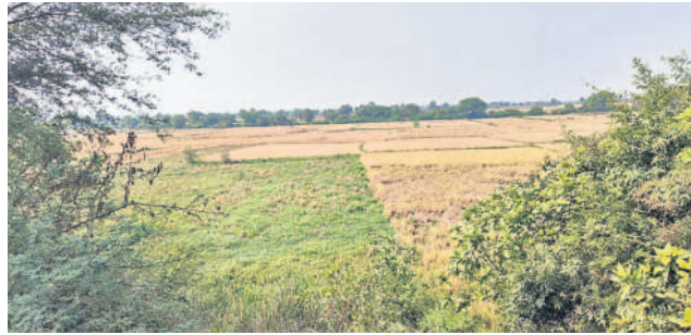
అయకట్టు కింద పాలాలు

దండపల్లి, డిసెంబర్ 17 : ఉమ్మడి ఆంధ్రప్రదేశ్ లో పాలకులు చెరువులపై దృష్టి సారించకపోవడంతో పెద్దపేట చెరువు అయకట్టు క్రమంగా తగ్గతూ వచ్చింది. కేసీఆర్ ప్రభుత్వం ప్రతిష్టాత్మకంగా ప్రారంభించిన మిషన్ కాకతీయతో చెరువు రూపురేఖలు మారిపోయాయి. మొదటి విడుదల తర్వాత (2015) భాగంగా రూ. 34 లక్షలతో పూడిక గట్ నిర్మాణం చేపట్టారు. పాలాలుకు వెళ్లే కాలువలకు మరమ్మత్తులు చేశారు. రెండో విడుదల తర్వాత మూడు శిథిలావస్థకు చేరుకోగా వాటి స్థానంలో కొత్తవి నిర్మించారు. దీంతో నీటి నిల్వ సామర్థ్యం పెరిగి అయకట్టు పెరిగింది. మూడో విడుదల తర్వాత రూ. 8 లక్షలతో కట్ట బలోపేతం చేశారు. దీంతో చెరువు దళ తిరిగింది. చెరువులో జలశక్తి ఉత్పాదక పనులకు ఉపాధి ఉన్న బావుల్లో నీరు ఉంటుంది. ఈ బావులకు మోటార్లు అమర్చుకొని యానగి వరి, మక్క పండిస్తున్నారు. ఖరీఫ్ లో మాత్రం తీసిపోకుండా యానగిలో సాగు చేస్తున్నారు.