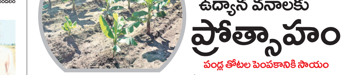
కెసీఆర్ ప్రభుత్వంలో అధిక ప్రాధాన్యత

అయిల్ పామ్ పంట సమావేశమన్నారు. ప్రతి పక్షం రాల్లో అయిల్ పామ్ సాగు చేయడం జరిగిందని తెలిపారు. రాష్ట్ర వ్యాప్తంగా మొత్తం 13 కంపెనీలు, 36 సర్కరిలను ఏర్పాటు చేసి, లక్షల మొక్కలను రైతులకు అందుబాటులో ఉంచారు. ఏటా 30-40 లక్షల మొక్కలను అందుబాటులోకి తెచ్చామని లక్షలతో ఆయా కంపెనీలు.. అవసరమైన సీడ్ మెటీరియల్ ను ఇండోనేషియా, థాయిలాండ్, మలేషియా, కోస్టారికా దేశాల నుంచి తీసుకొచ్చి 12 నెలల పాటు ఇక్కడి సర్కర్లో పెంచి రైతులకు పంపిణీ చేస్తున్నారని తెలిపారు. మొక్క నాణ్యత నాణ్యత నుంచి దిగుబడి ప్రాంతభేదమ్యే వరకు 4 ఏళ్ల పాటు ఎకరానికి రూ.50 వేల వరకు సబ్సిడీ ఇచ్చి కేసీఆర్ ప్రభుత్వం రైతులను ఎంతో ప్రోత్సహించడం వల్లనే రైతులు