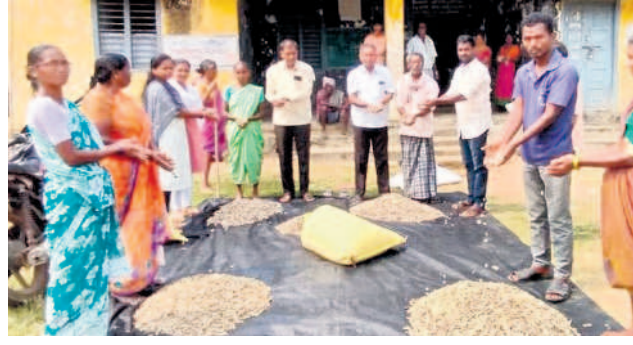
సేకరించిన ముప్పి గింజలను పరిశీలిస్తున్న అధికారులు