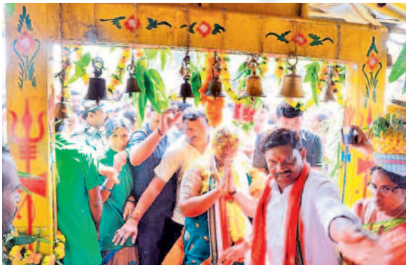
గట్టమ్మ తల్లిని దర్శించుకుంటున్న మంత్రి సీతక్క

ములుగు రూరల్, డిసెంబర్ 17 : అధిక నిధులు తీసుకువచ్చి నియోజకవర్గంలో పాటు రాష్ట్ర అభివృద్ధికి తన వంతుగా కృషి చేస్తానని రాష్ట్ర పంచాయతీరాజ్, గ్రామీణాభివృద్ధి, మహిళా శిశు సంక్షేమ శాఖ మంత్రి దనసరి అనసూయ సీతక్క అన్నారు. మంత్రిగా బాధ్యతలు చేపట్టిన అనంతరం ఆదివారం తొలిసారి సీతక్క ములుగు జిల్లా కేంద్రానికి రాగా మండలంలోని మహ్మద్ గౌస్ పల్లి, మల్లంపల్లి, జాకారం మీదుగా గట్టమ్మ వరకు ర్యాలీగా చేరుకున్నారు. అనంతరం ఆది దేవత గట్టమ్మకు మొక్కులు చెల్లించారు. అక్కడినుంచి జిల్లా కేంద్రానికి చేరుకున్నారు. ఈ సందర్భంగా సీతక్క మాట్లాడుతూ తన 20 ఏళ్ల రాజకీయ జీవితం, అంతకు ముందు ఉన్న ప్రజా ఉద్యమ జీవితంలో తాను ఎల్లప్పుడూ నియోజకవర్గ ప్రజల సేవలోనే ఉన్నట్లు తెలిపారు. ఈ ప్రాంత ప్రజలు, నాయకులు, అభిమానుల రుణం తీర్చుకోలేనిదన్నారు. మారుమూల ప్రాంతంలోని పేద కుటుంబానికి చెంది తనను ప్రజలు ఆశీర్వాదిస్తూ మంత్రి స్థానికి తీసుకువచ్చారన్నారు. మంత్రిగా బాధ్యతలు చేపట్టిన నాటినుంచి నియోజకవర్గ ప్రజలకు దూరంగా ఉండడం బాధ