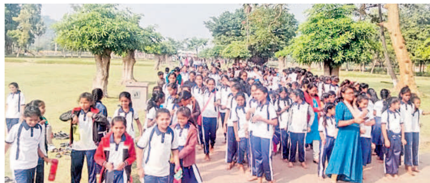
వెంకటాపూర్ : రామప్పలో దర్శనం కోసం బారులు తీరిన విద్యార్థులు