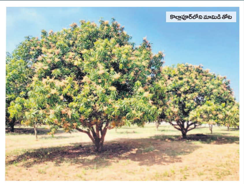
కొల్లాపూర్ లోని మామిడి తోట