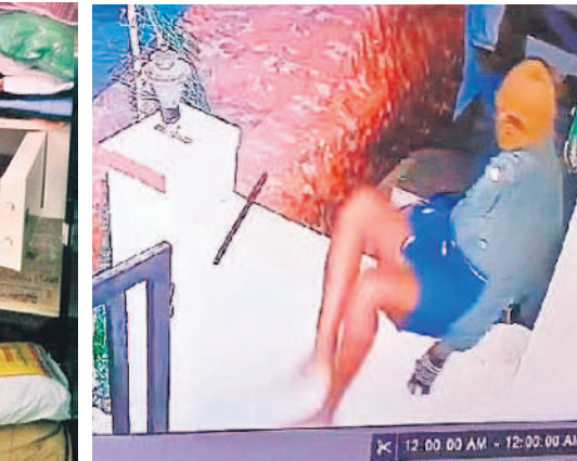
మక్కల్ లో ఓ ఇంట్లో బీరువా తాళాలు తెరిచి వస్తువులను చిందర వందరగా వేసిన దృశ్యం