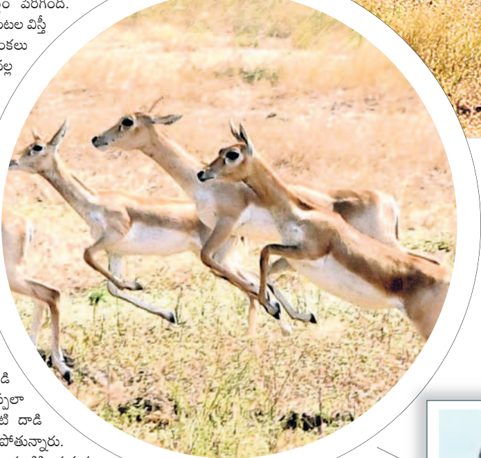
దంతో పంటల విస్తీర్ణం పెరిగింది. సాగునీటి వనరులు, పంటల విస్తీర్ణంతోపాటు కృష్ణ జింకలు పెరిగిపోవడంతో వాటి వల్ల రైతులు అందోళనకు గురవుతున్నారు.