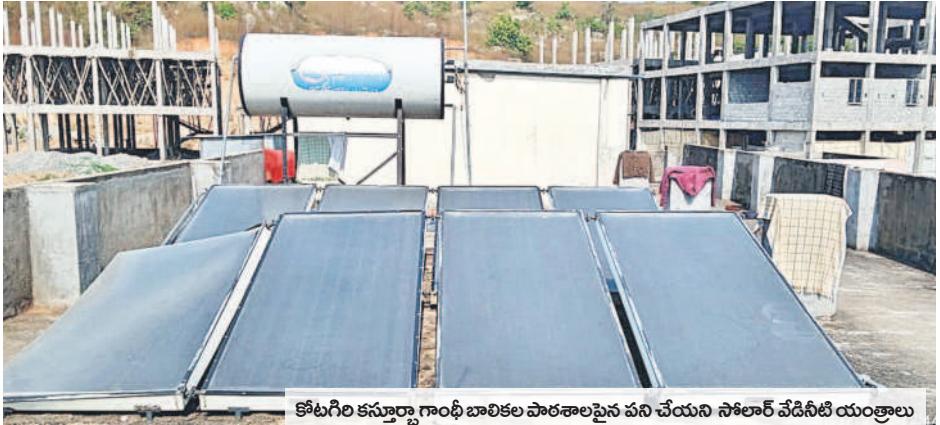
కోటగిరి కస్తూర్బా గాంధీ బాలికల పాఠశాలపైన పని చేయని సోలార్ వేడినీటి యంత్రాలు

లేకుండా చర్యలు తీసుకోవాల్సిన సంబంధిత ఉన్నతాధికారులు పట్టించుకోవడం లేదని వారు వాపోతున్నారు. పనిచేయని సోలార్ వేడి నీటి యంత్రాలు కోటగిరి మండల కేంద్రంలోని కస్తూర్బా గాంధీ బాలికల పాఠశాలలో సోలార్ వేడినీటి యంత్రాలు ఏర్పాటు చేశారు. అవి మరమ్మత్తులకు గురయ్యాయి. వాస్తవానికి రాష్ట్రంలో గత సంవత్సరం నుంచి అన్ని వసతి గృహాల్లో విద్యార్థుల స్నానానికి వేడి నీటిని అందించాలనే సూచనలు ఉన్నప్పటికీ ఇక్కడ మాత్రం యంత్రాలు పనిచేయడం లేదనే సెలంతో సంబంధిత శాఖ అధికారులు పట్టించుకోవడం లేదని విద్యార్థినుల తల్లిదండ్రులు వాపోతున్నారు. తప్పనిసరి పరిస్థితుల్లో విద్యార్థినులు చన్నీటి స్నానాలు చేసి అనారోగ్యానికి గురవుతున్నారు.