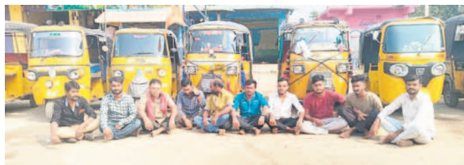
దహెగాం మండల కేంద్రంలో రోడ్డుపై బైరాయించిన ఆటో డ్రైవర్లు