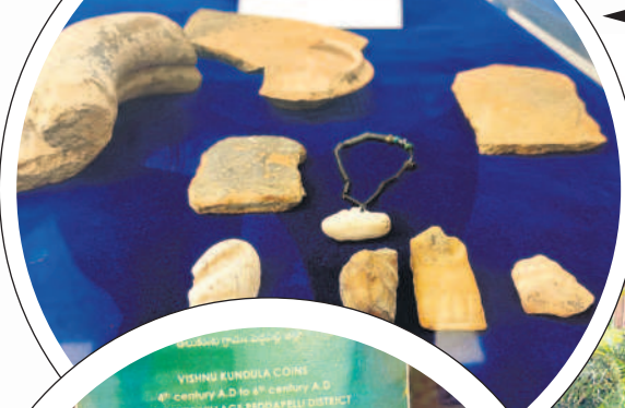
2544 సంవత్సరాల క్రితం తొలి చారిత్రాత్మక యుగం నాటి మట్టి పాత్రలు, అట వస్తువులు, ఆభరణాలు