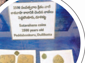
2300 ఏండ్లకంటే కంటే పాత అటవీ కాలానికి చెందిన శాతవాహన కాలానికి చెందిన నాణేలు

మ్యూజియంగా మార్చుకున్న కలెక్టరేట్ సముదాయం మందిరం లాటి