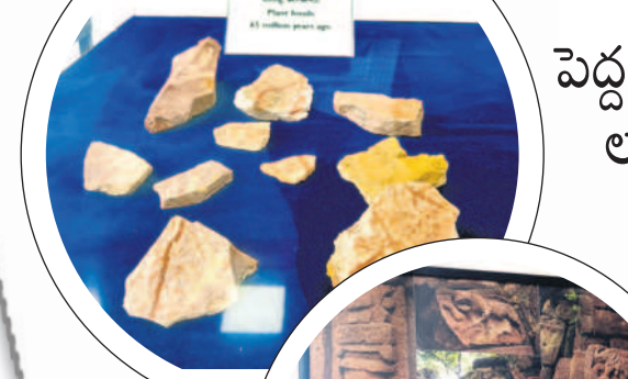
కోట్ల సంవత్సరాల క్రితం నాటి మొక్క శిలాజాలు