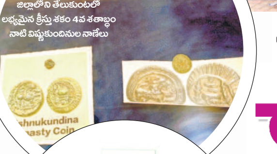
జిల్లాలోని తేలుకుంటలో లభ్యమైన క్రీస్తు శకం 4వ శతాబ్దం నాటి విష్ణుకుండినుల నాణేలు

జిల్లాలోని పెద్దపల్లి మండలం, ధూళికోటలో లభ్యమైన 2500 ఏండ్ల క్రితం నాటి శాతవాహన కాలానికి చెందిన నాణేలు