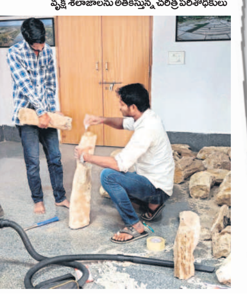
వృక్ష శిలాజాలను అతికిస్తున్న చరిత్ర పరిశోధకులు