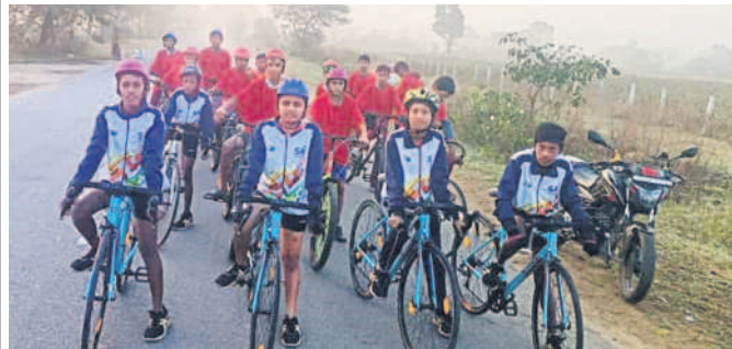
రామాయంపేటలో 2కే రన్ సైక్లింగ్ క్రీడా పోటీ