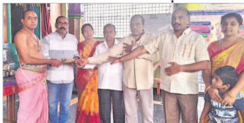
ఆలయ కమిటీ సభ్యులకు నగదు అందజేస్తున్న దంపతులు