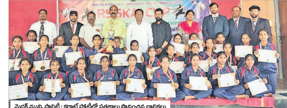
మెదక్ మున్సిపాలిటీ : కరాట్ పోటీల్లో పతకాలు సాధించిన బాలికలు