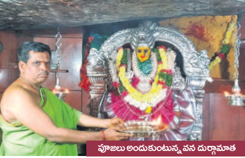
పుణ్యాలంకరణకుంట్ల వన దుర్గామాత