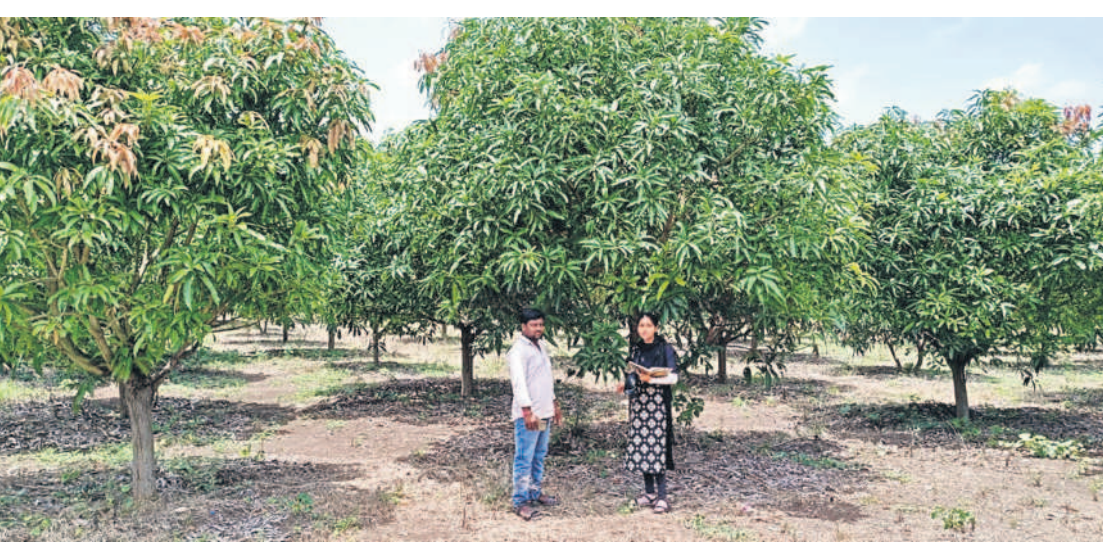
సంగారెడ్డి జిల్లా న్యాలకల్ లో మామిడి తోటలను సందర్శించి రైతులకు అవగాహన కల్పిస్తున్న ఉద్యాన వన శాఖాధికారి

చలికాలంలో మామిడి తోటల పెంపకంపై ప్రత్యేక శ్రద్ధ పెట్టాలి. చలి తీవ్రత పెరిగి కొద్ది మామిడి పంటను జాగ్రత్తగా కాపాడుకోవాలి. ఎప్పుడెప్పుడు యాజమాన్య పద్ధతులు పాటించాలి. దీంతో అధిక దిగుడులు సాధించొచ్చని ఉద్యాన అధికారులు, నిపుణులు సూచిస్తున్నారు. మామిడి సాగు రైతులు పూతకు ముందు సరైన జాగ్రత్తలు తీసుకోకపోవడంతో పూత ఆలస్యంగా వస్తుంటుంది. కొమ్మలు కత్తిరించడం, దున్నడం చేయకుండా మామిడి తోటలకు విశ్రాంతి ఇవ్వాలి. దీంతో పూత త్వరగా వచ్చే అవకాశం ఉంటుంది. కానీ చాలా మంది రైతులు పూతకు ముందు కొమ్మల కత్తిరింపు, దున్నడం వంటివి చేస్తుంటారు. ఇలా చేస్తే పూత ఆలస్యమయ్యే అవకాశం ఉంటుంది. ముఖ్యంగా పూత, పిండి, కాయలు కానీ సమయంలో తెగుళ్లు, చీడపీడల నివారణ చర్యలు చేపడతే మంచిదని సంబంధిత అధికారులు చెబుతున్నారు.