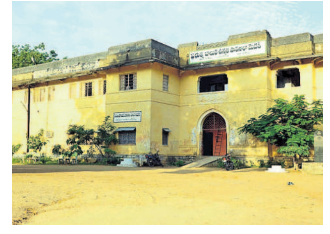
సోలార్ ప్లాంట్లకు ఎంపికైన పాఠశాలలు

ఉమ్మడి మెదక్ జిల్లాలో ఎంపికైన పాఠశాలలు మెదక్ జిల్లాలో 230 పాఠశాలలు సంగారెడ్డిలో జిల్లాలో 348 పాఠశాలలు నిల్లిమల జిల్లాలో 322 పాఠశాలలు