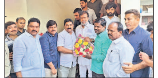
మంత్రి దామోదర రాజనర్సింహకు శుభాకాంక్షలు తెలుపుతున్న పీఠ్యయూటీఎస్ జిల్లా నేతలు