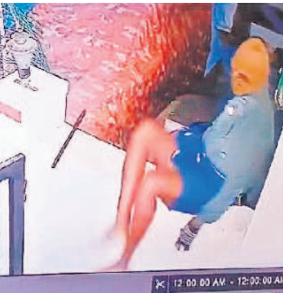
మక్కల్ లో ముఖానికి మాస్కు ధరించి ఓ ఇంటి గోడ దాకి లోపలికి ప్రవేశిస్తున్న దుండగుడు