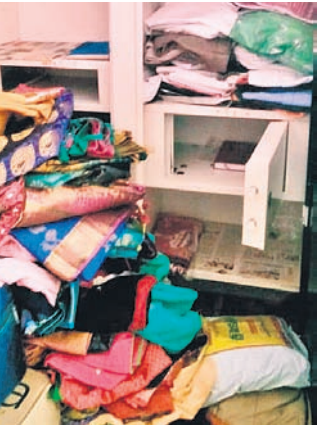
మక్కల్ లో ఓ ఇంట్లో భీరువా తాళాలు తెరిచి వస్తువులను చిందర వందరగా వేసిన దృశ్యం