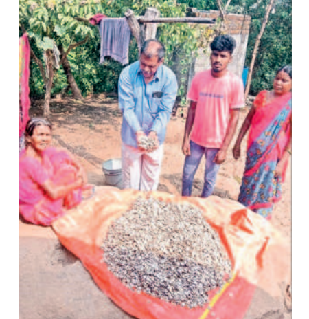
ముష్టి గింజలు సేకరించిన వృద్ధురాలు

అటవీ ఉత్పత్తులతో అడవి బడ్డలకు ఉపాధి కలుగుతున్నది. ముష్టి గింజల సేకరణ వారికి కల్పిత రుపుగా మారింది. వీటిని వివిధ ఔషధాల తయారీలో వినియోగిస్తుండడంతో డిమాండ్ పెరిగింది. అటవీ ప్రాంతాల్లో విరివిగా లభించే ముష్టి గింజలను ఈ నెల, వచ్చే నెలలోనే ఎక్కువగా కొనకొని, వచ్చే నెలలోనే ఎక్కువగా జరుగుతుంది. చెట్ల నుంచి కింద రాలిన ముష్టి కాయలను ముందుగా సేకరిస్తారు. వాటిని పగులుగొట్టి గింజలను తీసి ఎండబెడుతారు. తర్వాత వాటిని విక్రయిస్తారు. కొండరైతే చెట్లపైకి ఎక్కి పండగా మాచిన కాయలను రాల్చుకుంటారు. వాటిని ఏరుకోవడం, గింజలను ఎండబెట్టడం చేస్తుంటారు. వీటిని మార్కెట్లో ఇతరులు ఎవరూ కొనే అవకాశం లేనందున జిసీసీ మాత్రమే కొనుగోలు చేస్తుంది. ఆదాయం కల్పించే ముష్టిగింజల చెట్లను సరకడం చేయరు. చెట్ల పుష్పా ఉండడంతో ఎక్కువ కాయలు లభించే అవకాశాలు ఉన్నాయి. అడవిలో ఉండే ఈ చెట్ల వడ్డకు తరచూ వారు వెళ్తున్నందున నేరగా వాటి వడ్డకే వెళ్లి సేకరిస్తారు. ఇవి వివహారితమైన గింజలు కావడం వల్ల వీటి పట్ల సేకరణదారులు జాగ్రత్తలు తీసుకుంటారు. ఇండ్లల్లో నిల్వ చేసుకోవడం, చిన్న బిల్లలకు దూరంగా ఉంచడం చేస్తుంటారు.