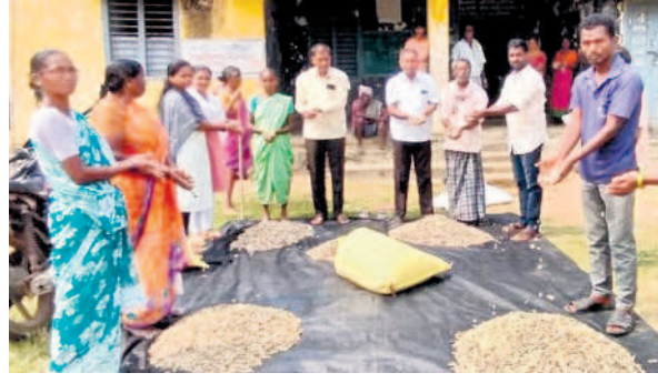
సేకరించిన ముష్టి గింజలను పరిశీలిస్తున్న అధికారులు