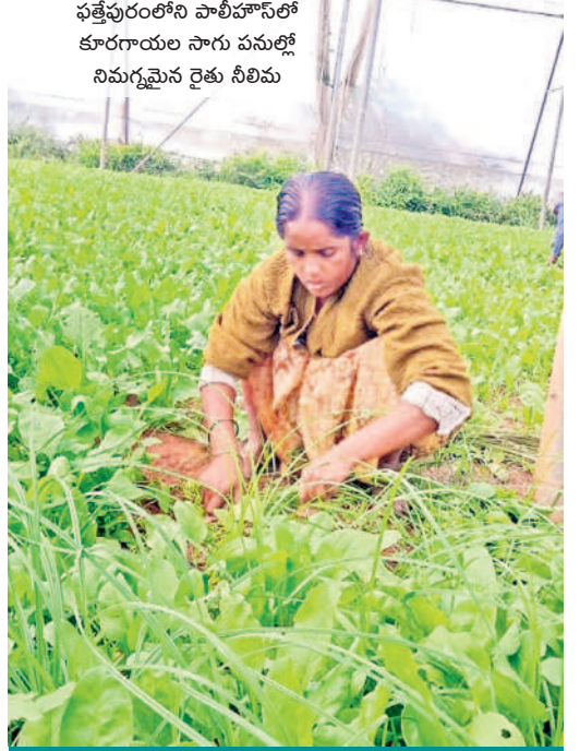
సాగు విధానం ఇలా..

నుమారు నాలుగు రోజులైనా పాడవకుండా నిల్వ ఉంచుకోవచ్చని, సహజ సిద్ధంగా సాగు జరగడంతో ఆకుకూరల రుచి కూడా బాగుంటుందనే అభిప్రాయాన్ని అందించే కలిగిందారు. దీంతో సాగుశ్రేణిలో దాక్టర్లు, వ్యాపారులు, టీచర్లు, ఎక్కువ సంఖ్యలో ప్రజలు వచ్చి కొనుగోలు చేస్తున్నారు. సహజసిద్ధంగా కూరలను పండిస్తూ పలువురి మన్ననలు పొందడమే కాకుండా సేంద్రియంలో బిడ్డలకు పంపిణీ చేయడానికి అనుకూలంగా నిలుస్తున్నారు.