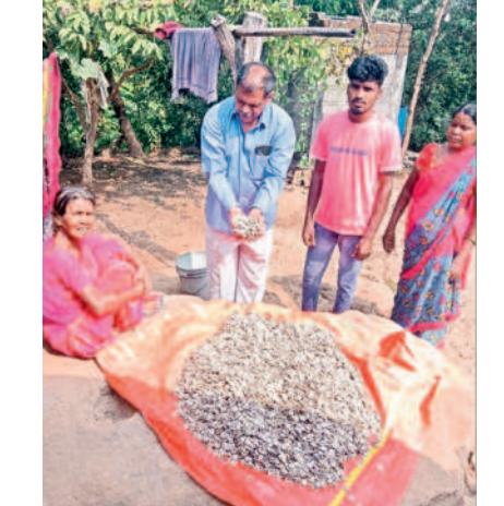
ముప్పిగింజలు సేకరించిన వృద్ధురాలు

అటవీ ఉత్పత్తులతో అడవి బడ్డలకు ఉపాధి కలుగుతున్నది. ముప్పి గింజల సేకరణ వారికి కల్పిత రుపుగా మారింది. వీటిని వివిధ ఔషధాల తయారీలో వినియోగిస్తుండడంతో డిమాండ్ పెరిగింది. అటవీ ప్రాంతాల్లో విరివిగా లభించే ముప్పి గింజలను ఈ నెల, వచ్చే నెలలోనే ఎక్కువగా కొనుగోలు చేసారు. వాటిని ఏరు కోవడం, గింజలను ఎండబెట్టడం చేస్తుంటారు. వీటిని మార్కెట్లో ఇతరులు ఎవరూ కొనే అవకాశం లేనందున జీసీసీ మాత్రమే కొనుగోలు చేస్తుంది. ఆదాయం కల్పించే ముప్పిగింజల చెట్లను సరకడం చేయరు. చెట్లు పుష్పం ఉండడంతో ఎక్కువ కాయలు లభించే అవకాశాలు ఉన్నాయి. అడవిలో ఉండే ఈ చెట్ల వడ్డకు తరచూ వారు వెళ్తున్నందున నేరంగా వాటి వడ్డే వెళ్లి సేకరిస్తారు. ఇవి వివహారితమైన గింజలు కావడం వల్ల వీటి పట్ల సేకరణదారులు జాగ్రత్తలు తీసుకుంటారు. ఇండ్లలో నిల్వ చేసుకోవడం, చిన్న బిల్లలకు దూరంగా ఉంచడం చేస్తుంటారు.