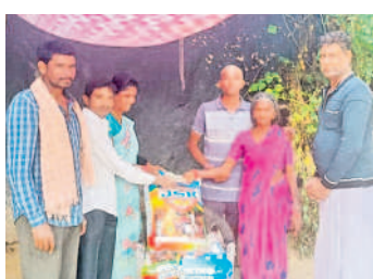
ఆర్థిక సాయం అందజేస్తున్న స్నేహితులు