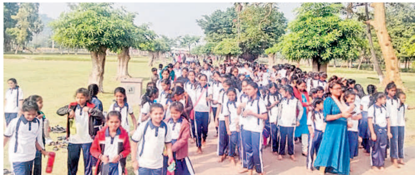
వెంకటాపూర్ : రామప్పలో దర్శనం కోసం బారులు తీరిన విద్యార్థులు