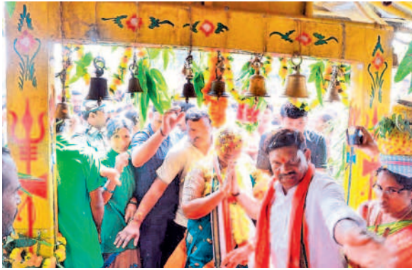
గట్టమ్మ తల్లిని దర్శించుకుంటున్న మంత్రి సీతక్క

ములుగు రూరల్, డిసెంబర్ 17 : అధిక నిధులు తీసుకువచ్చి నియోజకవర్గంలో పాటు రాష్ట్ర అభివృద్ధికి తన వంతుగా కృషి చేస్తానని రాష్ట్ర పంచాయతీరాజ్, గ్రామీణాభివృద్ధి, మహిళా శిశు సంక్షేమ శాఖ మంత్రి దనసరి అనసూయ సీతక్క అన్నారు. మంత్రిగా బాధ్యతలు చేపట్టిన అనంతరం ఆదివారం తొలిసారి సీతక్క ములుగు జిల్లా కేంద్రానికి రాగా మండలంలోని మహ్మద్ గౌస్ పల్లి, మల్లంపల్లి, జాకారం మీదుగా గట్టమ్మ వరకు ర్యాలీగా చేరుకున్నారు. అనంతరం ఆది దేవత గట్టమ్మకు మొక్కులు చెల్లించారు. అక్కడినుంచి జిల్లా కేంద్రానికి చేరుకున్నారు. ఈ సందర్భంగా సీతక్క మాట్లాడుతూ తన 20 ఏళ్ల రాజకీయ జీవితం, అంతకు ముందు ఉన్న ప్రజా ఉద్యమ జీవితంలో తాను ఎల్లప్పుడూ నియోజకవర్గ ప్రజల సేవలోనే ఉన్నట్లు తెలిపారు. ఈ ప్రాంత ప్రజలు, నాయకులు, అభిమానుల రుణం తీర్చు