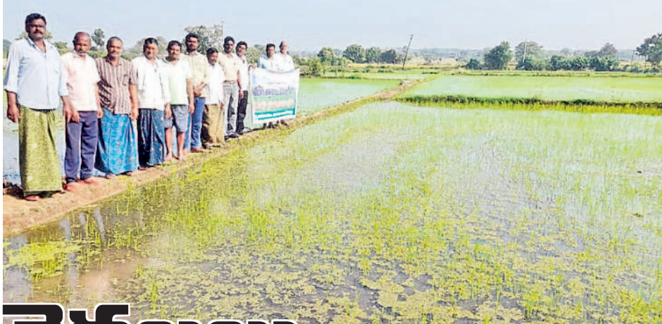
బంజారలో వెదజల్లే పద్ధతిలో నాటిన వరి పంటను పరిశీలిస్తున్న వ్యవసాయ అధికారులు, రైతులు