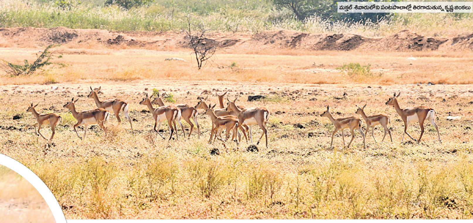
మక్కల్ శివారులోని పంటపొలాల్లో తిరగాడుతున్న కృష్ణ జింకలు

కృష్ణ జింకల లలజడి ఒకప్పుడు సాగునరు లేక నియోజకవర్గంలోని మక్కల్, మాగనూర్, కృష్ణ, నర్స మండలాల్లో రైతులను ఆముదం పంటతోపాటు బిరుదా న్యాల పంటలను సాగు చేస్తూ జీవనం కొనసాగిస్తుండేవారు. చిట్టెం నర్సరెడ్డి బ్యాంక్ లింగ్ రిజర్వాయర్, భూత్పూర్ రిజర్వాయర్లను పూర్తి చేసి భీమా నీటితో రెండు రిజర్వాయర్లను నింపడం వల్ల నియోజకవర్గంలోని అన్ని మండలాలకు సాగునీరు పుష్కలంగా అందుతుండడంతో పంటల విస్తీర్ణం పెరిగింది. సాగునీటి వనరులు, పంటల పొలాలపై దాడి చేయడంతో పంటలకు తీవ్ర నష్టం వాటిల్లుతుండడంతో రైతులు తీవ్ర ఇబ్బందులకు గురవుతున్నారు. జింకల బెడదల వల్ల కంటికి కునుకు వేరుదా పోయిందని రైతులు అంటోనని చెందుతున్నారు. జింకల బెడదల వల్ల కంటికి కునుకు వేరుదా పోయిందని రైతులు అంటోనని చెందుతున్నారు. జింకల బెడదల వల్ల కంటికి కునుకు వేరుదా పోయిందని రైతులు అంటోనని చెందుతున్నారు. జింకల బెడదల వల్ల కంటికి కునుకు వేరుదా పోయిందని రైతులు అంటోనని చెందుతున్నారు.