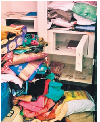
మక్కల్ లో ఓ ఇంట్లో బీరువా తాళాలు తెరిచి వస్తువులను చిందర వందరగా వేసిన దృశ్యం