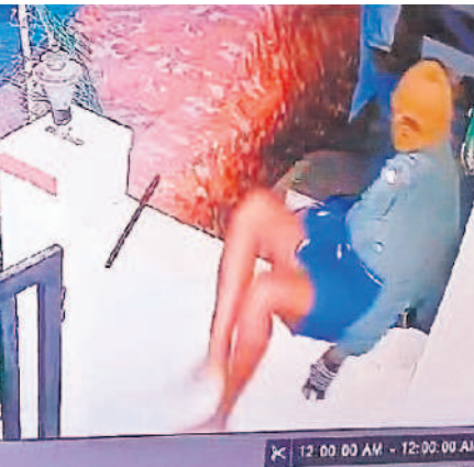
మక్కల్ లో మొఖానికి మాస్కు ధరించి ఓ ఇంటి గోడ దాకి లోపలికి ప్రవేశిస్తున్న దుండగుడు