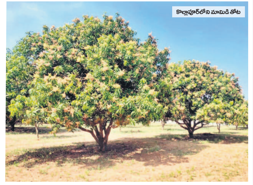
కొల్లూపూర్ లోని మామిడి తోట