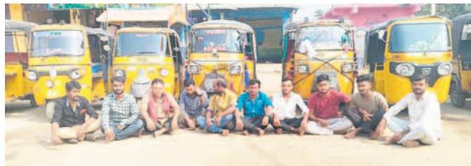
దహెగాం మండల కేంద్రంలో రోడ్డుపై బైరాయించిన ఆటో డ్రైవర్లు