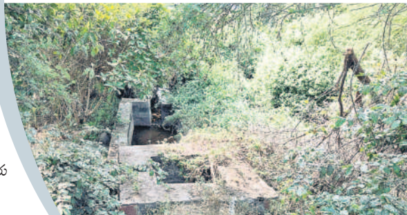
నూతనంగా నిర్మించిన తూములు

మంచిర్యాల జిల్లా దండేపల్లి మండలంలోని పెద్దపేట చెరువు రైతుల పాలిట కల్పతరువుగా మారింది. చెరువు నీటితో వానకాలంతోపాటు యాసంగిలోనూ రైతన్నలు పంటలు సాగు చేస్తున్నారు. వరి, మక్కతోపాటు ఇతర ఆరుతడి పంటలు పండిస్తూ ఆర్థికంగా ప్రయోజనం పొందుతున్నారు. మండు వేసవిలో కూడా చెరువు కింద వ్యవసాయ బావుల్లో నిండా నీరు, ఎక్కడ చూసినా పచ్చని పంటలతో ఈ ప్రాంతం విరాజిల్లుతోంది. ఎండాకాలంలో కూడా బావులు నిండుగా నీటితో కళకళలాడుతాయి. - దండేపల్లి, డిసెంబర్ 17