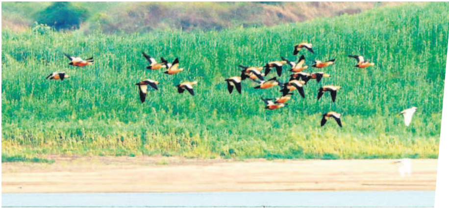
పెంచికల్ పేట్ : ప్రాణహిత వద్ద వలస పక్షులు