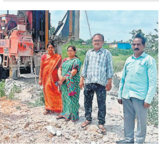
బోరును పరిశీలిస్తున్న అధికారులు

ఈ పథకం కింద గిరిజన రైతులను గుర్తించి, వారి భూముల్లో జియాలజిస్ట్ సర్వే చేస్తారు. ఆయన సిఫార్సు చేసిన చోట బోరు బావి తవ్వింది, విద్యుత్ సదుపాయం కల్పించి మోటరు పంపును ఏర్పాటు చేస్తారు. ఆపసరమైన చోట భూమి అభివృద్ధి పనులు, సహజ వనరుల యాజమాన్యం పనులు చేపడుతారు. ఈ పథకానికి గిరిజనులే అర్హులు. ఇద్దరు లేదా అంత కంటే ఎక్కువ వ్యక్తులను కలిపి ఒక బ్లాక్ గుర్తిస్తారు. ఒకే కుటుంబానికి చెందిన వారై ఉండకూడదు. ఒక బ్లాక్లో ఐదెకరాలకు మించి భూమి ఉండాలి. ఒక బ్లాక్ కు చెందిన భూమి కంటే నూర్వూగా ఉండాలి. షెడ్యూల్డ్ తెగల వారికి సంబంధించిన అప్లైడ్, పట్టా భూములు కూడా పరిగణలోకి తీసుకుంటారు.