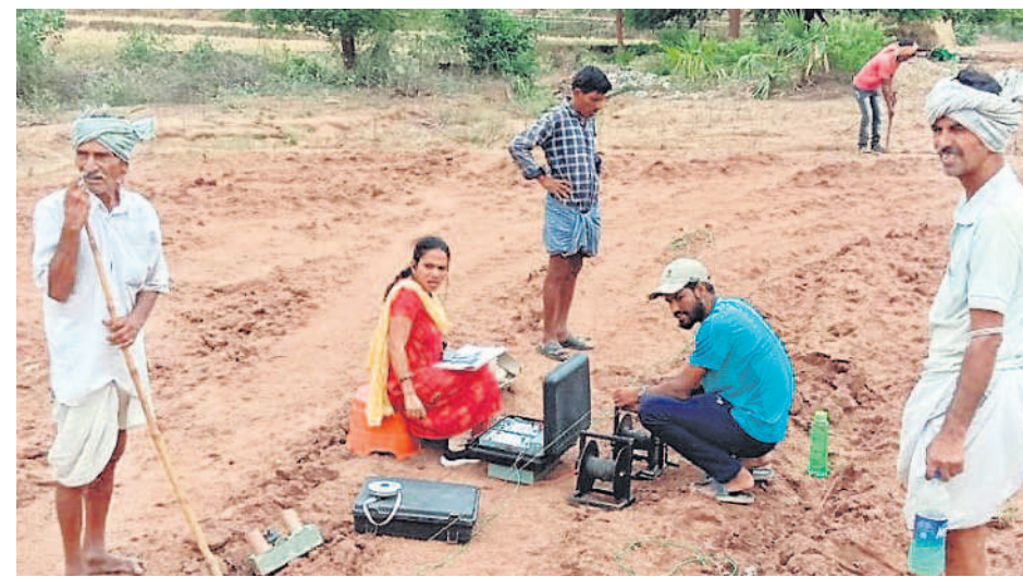
నారాయణపురం మండలం పల్లెగట్టుతండాలో బోరు వేసేందుకు సర్వే చేస్తున్న జియాలజిస్ట్

యాదాద్రి భువనగిరి, డిసెంబర్ 17 (నమస్తే తెలంగాణ) : ఎన్టీ రైతులను ప్రోత్సహించేందుకు ప్రభుత్వం గిరిజన వికాసం పథకాన్ని ప్రవేశపెట్టింది. గిరిజన భూములను సాగులోకి తీసుకురావడం, వారికి కావాల్సిన మౌలిక సదుపాయాలను కల్పించడమే లక్ష్యంగా తీసుకొచ్చిన ఈ పథకాన్ని గిరిజన సంక్షేమ శాఖ అమలు చేస్తున్నది. నగదు బదిలీ ద్వారా కాకుండా ప్రత్యేకంగా గిరిజన రైతులకు రాష్ట్ర ప్రభుత్వం సహాయ సహకారాలు అందిస్తున్నది. సొంతంగా బోరు, మోటరు, విద్యుత్ సౌకర్యం కల్పించుకోలేక మెట్ట పంటలు సాగు చేసుకునే గిరిజనుల భూములకు ఈ పథకం ద్వారా సాగు నీటి వసతి కల్పిస్తారు. గిరిజన రైతుల పొలాలకు బోర్లు వేయిస్తారు. బావులు తవ్విస్తారు. బోర్లు ఉన్న రైతులకు విద్యుత్ సదుపాయం కల్పిస్తారు. ఉపాధి హామీ పనుల ద్వారా బండరాళ్లు, పిప్పి మొక్కలు, స్ట్రావ్లు, తొలగించి బంజరు భూములను సాగుకు యోగ్యంగా మారుస్తారు. పండ్ల మొక్కల సరఫరాతోపాటు సాగులో సలహాలు కూడా అందిస్తారు.